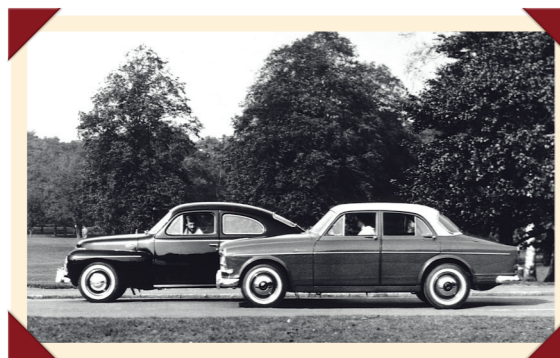
De oude PV544 en de nieuwe 122 stonden lange tijd aan zij in de Volvo-brochure.

In 1966 ging de inmiddels zwaar verouderde PV544 na twintig jaar trouwe dienst met pensioen. Om minder vermogende klanten voor een aan-