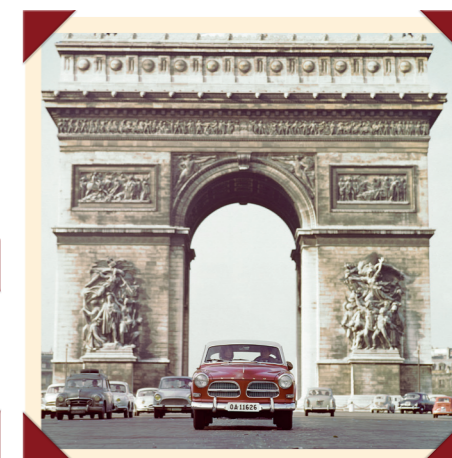
De Volvo 122 Amazon leende zich prima voor verre vakantie-reizen!