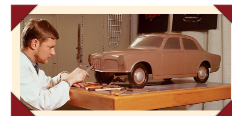
De Amazon-serie: ontworpen in de geest van de Amerikaanse designstijl.

de Kombi verscheen, die met zijn tweedelige achterklep overduidelijk ook voor de Noord-Amerikaanse markt was bestemd, was het gamma compleet. In de tijd dat combi's in Europa over het algemeen nog vooral als sobere bedrijfswagen werden uitgevoerd, ontwikkelden 'station wagons' zich aan de andere kant van de Atlantische Oceaan tot ruime gezinswagens voorzien van dezelfde luxe uitrusting als de sedans waarvan ze waren afgeleid, maar met meer laadruimte. De exportversies voor de VS kregen naast de sterkere motor van de 122S ook een extra stootbeugel op de voorbumper.