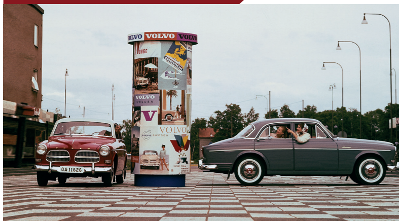
Een moderne en stijlvolle auto die de hele wereld kan waarderen.

Met zijn Amerikaanse looks viel de 122S zeer in de smaak bij het Amerikaanse publiek. Nadat eerder de PV544 en de Volkswagen Kever vanwege hun betrouwbaarheid de reputatie van Europese auto's een flinke impuls hadden gegeven, was de nieuwe Volvo de perfecte keus voor mensen die zich wilden onderscheiden met een auto die je niet op elke straathoek tegenkwam. Mede dankzij de sterk groeiende economie deed Volvo dan ook goede zaken met zijn export-Amaزون en werd Amerika een van de belangrijkste markten voor de kleine fabrikant uit Göteborg.