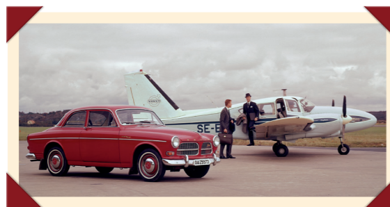
Een Europese luxe auto.

trekkelijk geprijsd model naar de showrooms te lokken, bracht Volvo in Scandinavië een uitgekledede versie van de 121 uit: de Amazon Favorit. Dit instapmodel zonder chroomlijsten, sigarenaansteker en zonneklep aan passagierszijde was alleen leverbaar met de oude drieversnellingsbak. Nadat de kleurkeuze aanvankelijk beperkt bleef tot zwart met een rood interieur, werd de auto later ook in wit aangeboden.