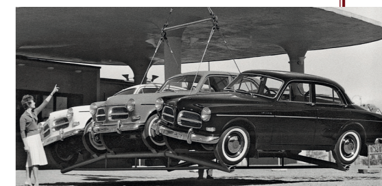
De Volvo 122S werd oorspronkelijk ontworpen voor de export.

Na de vierdeurs 121 en de 122S werd het Amazon-aanbod in 1961 uitgebreid met een tweedeurs versie. Toen in 1962