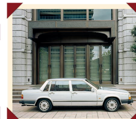
Het stijlvolle silhouet paart Europese eenvoud aan Amerikaanse stijl.