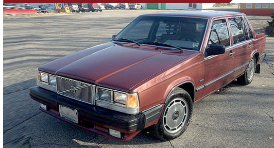
De 760 had de eerste paar jaar zwarte buitenspiegelkappen.

Luxe en comfort stonden bij de 760 op een hoog niveau. De stoelen waren bekleed met dik velours in een kleur die paste bij die van de carrosserie. Optioneel kon ook worden gekozen voor leren bekleding. Elektrische ruitbediening en airco waren standaard aanwezig, evenals veel andere comfortvoorzieningen. Van het begin af aan was de auto ook verkrijgbaar met drietraps automatische transmissie met overdrive.