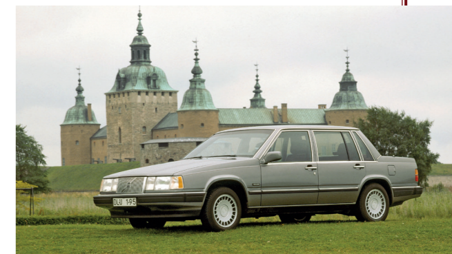
Na de restyling van 1988 verliezen de Amerikaanse versies hun eigen gezicht en zijn ze alleen nog herkenbaar aan de verticaal in plaats van horizontaal gescheiden verlichtingsunits op de hoeken.

Als paradepaardje van het Volvo-gamma was de 760 met een V6-motor uitgerust. Deze van de 260 overgenomen krachtbron was ontwikkeld in samenwerking met de Franse merken Peugeot en Renault en had daarom de naam PRV (Peugeot-Renault-Volvo) gekregen. De interne