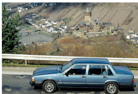
De Volvo 760 is een ideale reiswagen: ruim en geschikt voor elk type weg.

Dat Volvo's tot nog vrij onlangs 'blokendozen op wielen' werden genoemd, vindt zijn oorsprong in de strakke, typisch Scandinavische designstijl van de 200-serie. Op de nieuwe sedan had Jan Wilsgaard, die ook de 140- en de 240-serie tekende, die stijl tot in het extreme doorgetrokken. Bedrijfseconomische motieven waren er ook, want