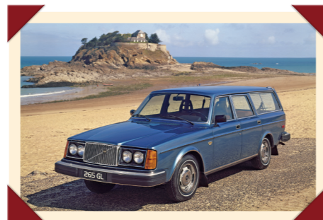
Het front van de Amerikaanse 265 oogt vrij barok.

Voor de exportversies van de nieuwe 760 werd een nieuwe koplampvariant bedacht, waarbij de oorspronkelijke units werden vervangen door exemplaren met twee kleine rechthoekige lampen met daaronder een smalle strook transparant glas. De richtingaanwijzers kregen wit glas, terwijl de stadslichten naar de hoeken verhuisden om dienst te doen als zijmarkeringslichten.