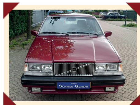
Door de Amerikaanse koplampen krijgt de 760 een wat agressievere blik.

In de jaren 50 en 60 werden de PV444, de PV544 en de Amazon, die in de Verenigde Staten onder de naam 122S werd verkocht, voorzien van om de hoeken doorlopende bumpers in de Amerikaanse stijl van die tijd. Omdat ze aan de Amerikaanse normen moesten voldoen, kregen de modellen van de 140-serie later afwijkende richting-