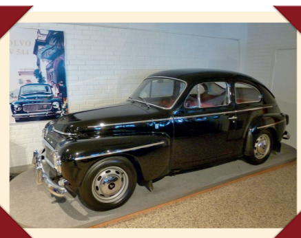
... om rechtstreeks naar het Volvo-museum in Göteborg te gaan.