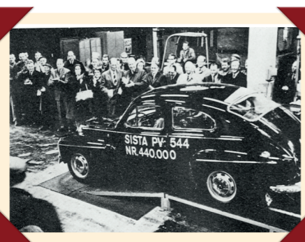
De laatste PV544 verlaat de productielijn...

maar zonder de herinneringsopschriften die om onopgehelderde redenen zijn verdwenen.