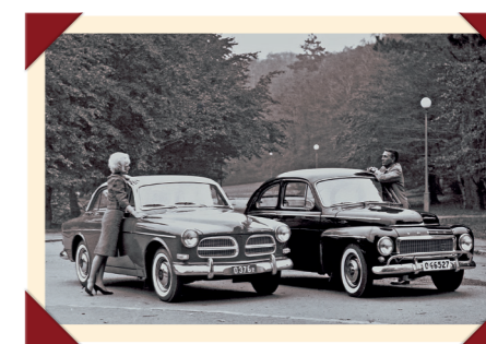
De Amazon en de PV544 stonden lange tijd gezamenlijk in de Volvo-brochure.

De sterkere motor maakte ook een nieuwe schaal aanduiding op de snelheidsmeter noodzakelijk: deze liep nu in plaats van tot 160 km/h door tot 180 km/h, wat vanzelfsprekend ook een zekere statusverhoging betekende. Tot het einde van zijn productieperiode in het najaar van 1965 onderging de PV544 in totaal zeven modelherzieningen. Intern werden daar de letters A tot en met G voor gebruikt, wat achteraf de datering, bijvoorbeeld ten behoeve van een restauratie, een stuk eenvoudiger maakt.