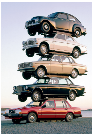
Volvo's zijn degelijk en in de loop der jaren sterk verbeterd! Het bewijs? Deze stapelstunt!

Uit hoofde van kostenbesparingen was het basisontwerp nauwelijks gewijzigd, maar op een aantal belangrijke punten was het model wel