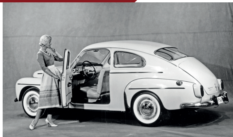
De PV544 kreeg een geheel vernieuwd interieur.

van het opschrift 'SISTA PV544 NR. 440.000'. Deze auto, die als enige PV544 Sport ooit in de kleur zwart de fabriek verliet, ging rechtstreeks naar het Volvo-museum in Göteborg. Daar staat hij nog altijd,