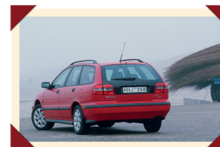
De V40 heeft een ruime kofferbak.

Gezien de gangbare leasetermijn van drie jaar was het essentieel de niet erg merktrouwe kopers in dit segment tijdig iets nieuws aan te bieden. Daarom kwam Volvo in 2000 met een grondig herziene versie, die herkenbaar was aan de gewijzigde koplampunits, bumpers en frontgrille. Ook het interieur was opgefrist en natuurlijk was ook de veiligheid opnieuw naar een nog hoger plan getild. Zo kon het model weer een paar jaar mee. Ondertussen werd hard gewerkt aan de opvolger die in 2005 als V50 het levenslicht zag.