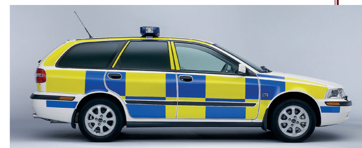
Compact, ruim en snel: een ideale surveillancewagen.

O mdat Volvo met zijn nieuwe middenklasser nieuwe klanten aan zich wilde binden, verscheen de Volvo S40/V40 met een groot aantal verschillende viercilinder benzine- en dieselmotoren met een cilinderinhoud