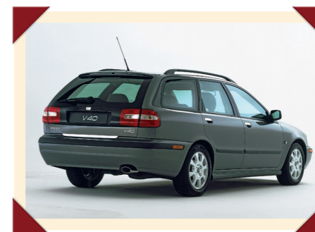
In 2000 kreeg de V40 een lichte restyling.

variërend van 1600 tot 2000 cm 3 . De sterkste variant daarvan was voorzien van een turbocompressor. Een 5-deurs hatchback als directe opvolger van de 440 kwam er niet, maar de V40 stationwagon vormde daarvoor een prima alternatief. Ondanks zijn compacte buitenafmetingen bood deze niet alleen meer ruimte, maar ook een stuk meer veelzijdigheid, waarmee hij de V van 'Versatility' in zijn typenaam meer dan waarmaakte.