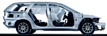
Een echte Volvo: veilig en robuust.

H alverwege de jaren 1990 voerde Volvo een complete herziening van zijn modellenprogramma door. De marketingbazen in Göteborg grepen deze gelegenheid aan voor de invoering van een nieuw typeaanduidingssysteem. Omdat de aanvankelijke oplossing met slechts één letter en één cijfer ongetwijfeld op bezwaren van concurrent Audi zou stuiten, kwam men uiteindelijk met een systeem van twee cijfers en één letter. Voor de nieuwe compacte middenklasser die de 400-serie (440, 460 en 480) moest opvolgen, leidde dat tot de namen S40 en V40, waarbij de S stond voor 'Saloon' (sedan) en de V voor 'Versatility' (veelzijdigheid). Met deze nieuwe, wat hoger geïmponeerde modellen waarvan het design was geïnspireerd op de ECC- concept-