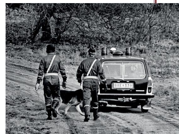
De standaard Volvo 145 werd vooral door hondenbrigades gebruikt.

Veel Zweedse politiekorpsen hadden een of meer exemplaren van de 145 zonder verhoogd dak in hun vloot.