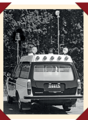
De achterzijde van de 145 Express Polis was rijk voorzien van lampen.

met een motor die dankzij een verbeterd injectiesysteem meer vermogen leverde dan de standaardmotor. In het leveringscontract was een terugkoopclausule opgenomen die Volvo in staat moest stellen naderhand te analyseren hoe de nieuwe injectiemotor zich in de praktijk had gehouden, maar het korps van Malmö hield de auto zo lang in gebruik dat deze optie nooit in praktijk is gebracht.