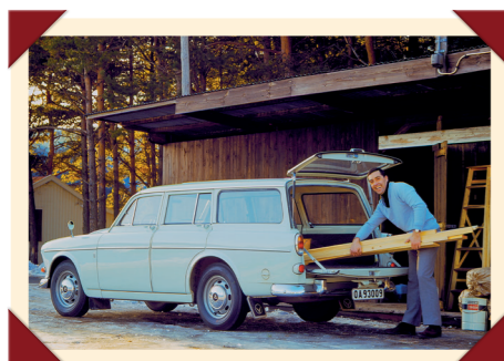
Dankzij de tweedelige achterklep is de laadruimte bijzonder goed toegankelijk.

Ondanks het feit dat Zweden pas in 1967 overschakelde van links naar rechts rijden, hadden Volvo's ook vóór die tijd het stuur al links. De Amazon was de eerste Volvo die ook werd gebouwd met het stuur rechts. Deze versies waren bedoeld voor exportmarkten als Groot-Brittannië, Australië en Japan.