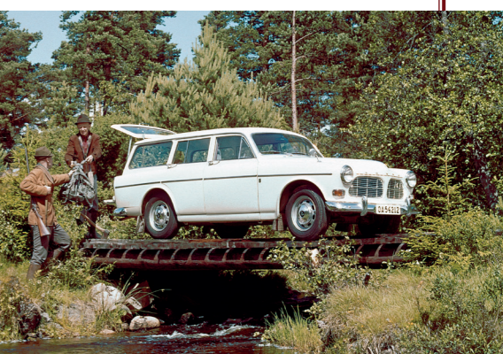
Anders dan zijn vlotte styling deed vermoeden, was de Amazon Kombi ook een werkpaard.

scharnierend aangebracht, zodat de klep tijdens het rijden open kon blijven. Voor nog meer ruimte in het interieur kon de achterbank worden neergeklapt: zo ontstond een regelmatig gevormde laadruimte met een lengte van 183 cm en een breedte van 126 cm. Dankzij de twee robuuste kokerbalken waarop het nieuwe achterdeel van de carrosserie steunde, bedroeg het nuttig laadvermogen 490 kg.