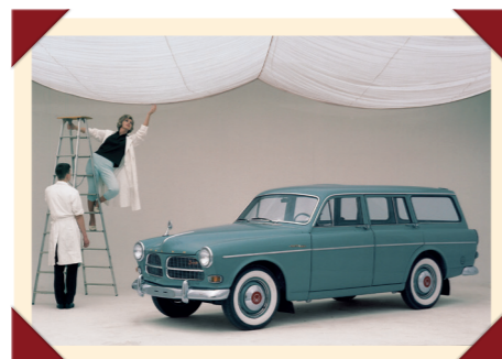
Zijn stijlvolle vormgeving maakte de Amazon Kombi ook populair in artistieke kringen.