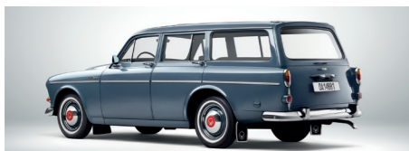
Met de P220 bewees Volvo dat functionaliteit en elegantie heel goed kunnen samengaan.

N a het verschijnen van de Amazon vierdeurs sedan in maart 1957 en de tweedeurs versie in oktober 1961 was het wachten op de stationwagens, die bij de start van het project eveneens op het programma stond. De Amazon was namelijk zo succesvol dat Volvo's productiecapaciteit ontoereikend was geworden voor een nieuwe variant. Om die reden zou het bijna vijf jaar duren voordat de 'Kombi' het licht zag. Dit bood de ontwikkelingsafdeling wel volop gelegenheid om het concept te perfectioneren en de kinderziekten van de sedan te verhelpen. Of die lange incubatietijd ook ten grondslag lag aan de statige naam Herrgårdsvagn ('herenhuiswagen') waarmee de publiciteitsafdeling op de proppen kwam, valt niet meer te achterhalen.