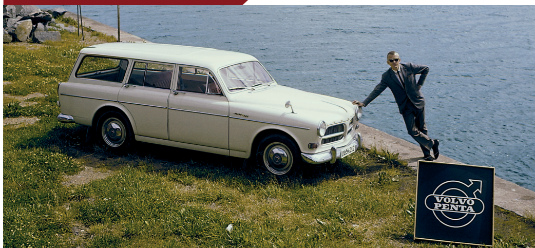
Voor scheepsmotorenfabrikant Volvo Penta waren de auto's van het moederbedrijf natuurlijk de eerste keus.

Dat de Volvo Amazon stationwagon als gezinsauto zo populair was, betekende niet dat hij het op de zakelijke markt slecht deed. Hij bood weliswaar minder laadruimte dan de nog altijd verkrijgbare Duett, maar stelde daar een hoog rijcomfort tegenover, iets wat zeker in een land als Zweden met zijn lange afstanden een sterke troef was. Nutsbedrijven en overheidsdiensten schaften hem daarom op grote schaal aan als dienst- of servicewagen, terwijl ook vertegenwoordigers en kleine zelfstandigen die veel met de