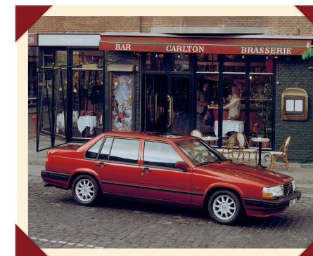
Ondanks zijn forse formaat straalde de 940 ook stijl en elegantie uit.

Het motorenaanbod verschilde van markt tot markt, afhankelijk van de vraag en de lokale milieuwetgeving. Naast de vier- en zescilinder-benzinomotoren werden ook zescilinderdiesels afkomstig van Volkswagen aangeboden.