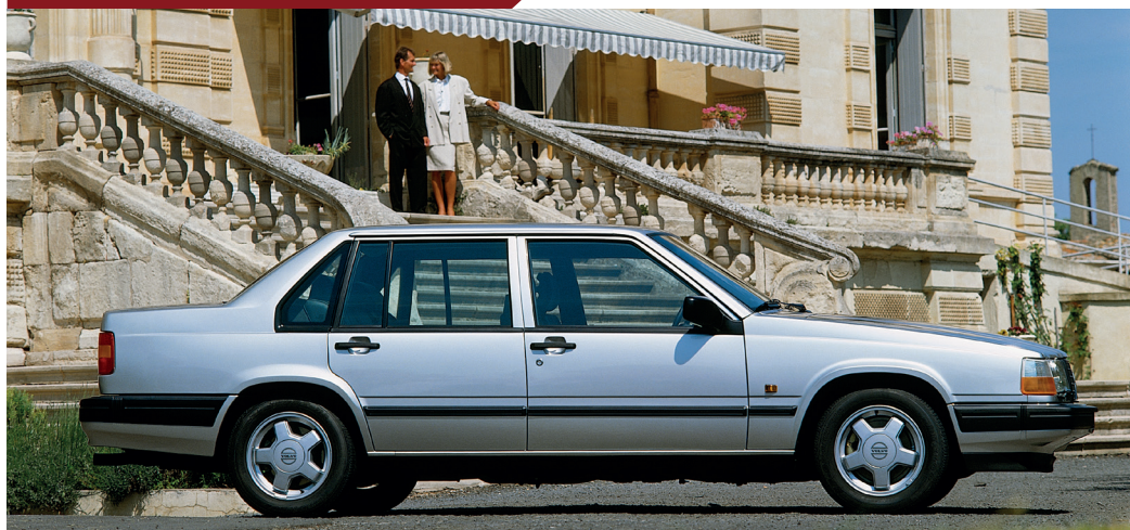
De kofferbak van de 940 was aanmerkelijk groter dan die van de 740.

Ondanks zijn niet spectaculair gewijzigde uiterlijk bleek de opfrisbeurt genoeg om de 940 sedan een tweede jeugd te geven: zijn nieuwe techniek en verjongde look gaven de verkopen een nieuwe impuls, waarbij hij met name in Zuid-Europa en de Verenigde Staten de Estate in de verkoopstatistieken een neuslengte voor wist te blijven.