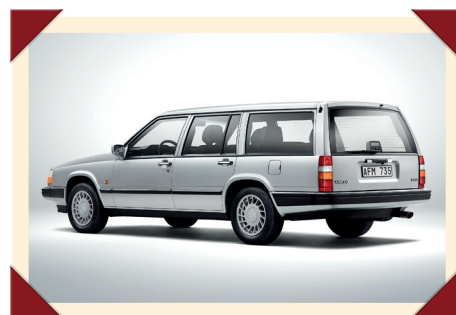
Het motorenaanbod voor de stationwagon was identiek aan dat voor de sedan.

de 960-modellen zitten daarbij in een wat hoger segment dan de 940-versies. Waarom dan wel wordt vastgehouden aan de '4' en '6' – die dus niet langer verwijzen naar het aantal cilinders – blijft een raadsel. Om het extra verwarrend te maken, behield de Amerikaanse 940 de neus van de oude 740 en kreeg de 940 in sommige andere landen het front van de gefacelifte 740 Turbo, ook als er geen turbomotor onder de kap ligt. Zelfs de grootste Volvo-kenners worden hierdoor wel eens op het verkeerde been gezet.