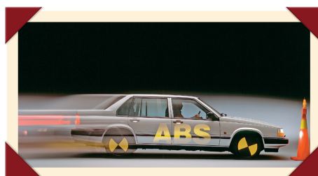
ABS was in die tijd een noviteit.

Waar de naamgeving voorheen altijd uitblonk in helderheid, laat Volvo bij de 900-serie het middelste cijfer voortaan verwijzen naar de marktpositionering: