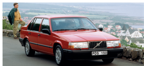
De basisversies zijn herkenbaar aan hun zwarte bumpers.

D e Volvo 740 werd in 1984 geïntroduceerd als een soberdere versie van de twee jaar eerder uitgebrachte 760. In eerste instantie was de auto alleen verkrijgbaar als sedan, maar een jaar later volgde ook de stationwagon, wat Volvo natuurlijk min of meer aan zijn stand verplicht was. Met zijn hoekige vormen groeide deze grote, moderne combi al snel uit tot een merkicoon. De luxe, maar toch bescheiden auto werd over de hele wereld gewaardeerd om zijn hoge veiligheidsniveau en betrouwbaarheid. De 740 had een viercilindermotor en de 760 een zescilindermotor. Beide modellen werden in een groot aantal uitrustings- en motorvarianten aangeboden. In 1989 onderging de