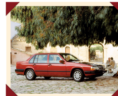
Door zijn strakke lijnen oogde de 940 groter dan hij was.