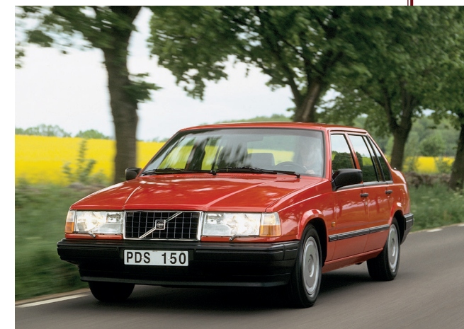
Als comfortabele reiswagen wist de Volvo 940 zowel in Europa als in Noord-Amerika een trouwe groep klanten voor het Zweedse merk te winnen.

Als opvolger van de 700 onderscheidde de 900-serie zich niet alleen met een vernieuwd uiterlijk en interieur, maar ook met innovatieve veiligheids- en comfortvoorzieningen. Zo heeft de