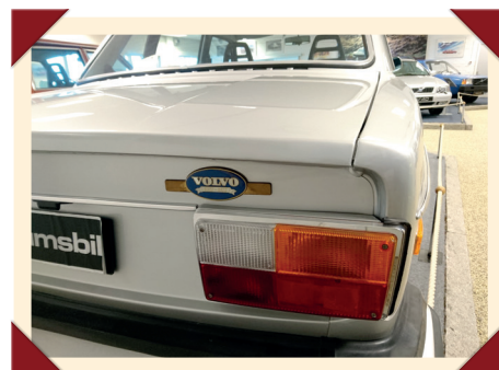
Het 244-typeplaatje op de achterzijde moest wijken voor het speciale Anniversary-embleem.

breiden met een aantal kleine modellen die zowel betaalbaar als relatief zuinig waren.