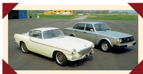
De 244 Anniversary zij aan zij met een van de eerste P1800's.

In de loop van de jaren 1970 kwam de auto-industrie in zwaar weer terecht. De oliecrisis van 1973 maakte een eind aan een lange periode van voortdurende groei. Er gingen autofabrikanten failliet, andere fuseerden of werden overgenomen. Ook Volvo kreeg het moeilijk. Dankzij de sterke vrachtwagendivisie stond het concern er financieel niet slecht voor, maar de personenautotak was te klein om zelf de middelen te kunnen opbrengen voor de investeringen die nodig waren voor de toekomst. Er kwamen gesprekken op gang met de Zweedse rivaal Saab, die vanwege te grote verschillen in bedrijfs-cultuur op niets uitliepen. Vervolgens richtte Volvo zijn pijlen op DAF, dat eveneens te klein was om zelfstandig te kunnen overleven. Door de overname van het Eindhovense bedrijf konden de Zweden hun aanbod in korte tijd uit-