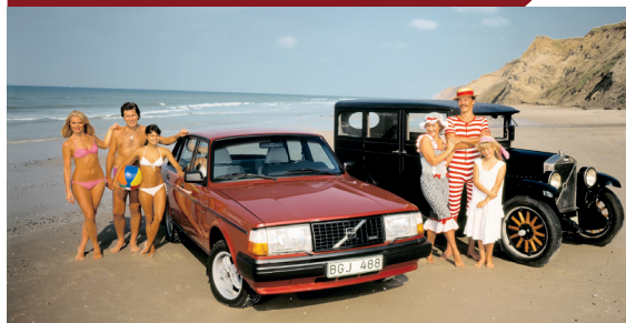
Twee Volvo-families op het strand, met vijftig jaar ertussen...

In de loop van de jaren 1970 kwam de auto-industrie in zwaar weer terecht. De oliecrisis van 1973 maakte een eind aan een lange periode van voortdurende groei. Er gingen autofabrikanten failliet, andere fuseerden of werden overgenomen. Ook Volvo kreeg het moeilijk. Dankzij de sterke vrachtwagendivisie stond het concern er financieel niet slecht voor, maar de personenautotak was te klein om zelf de middelen te kunnen opbrengen voor de investeringen die nodig waren voor de toekomst. Er kwamen gesprekken op gang met de Zweedse rivaal Saab, die vanwege te grote verschillen in bedrijfs-cultuur op niets uitliepen. Vervolgens richtte Volvo zijn pijlen op DAF, dat eveneens te klein was om zelfstandig te kunnen overleven. Door de overname van het Eindhovense bedrijf konden de Zweden hun aanbod in korte tijd uit-