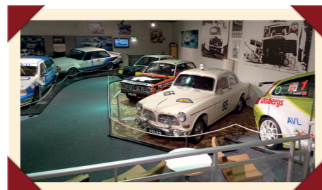
In het Volvo-museum in Göteborg staat deze gerestaureerde 122S uit 1966 tussen andere Volvo's die hun sporen in de autosport hebben verdiend.