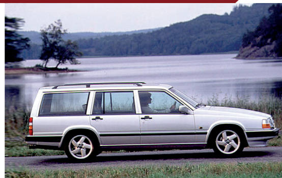
Ondanks de hoekige vormen oogt de 940 stationwagon stijlvol en dynamisch.