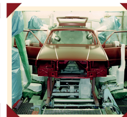
Bij de productie van de 940 gaat kwaliteit voor alles.