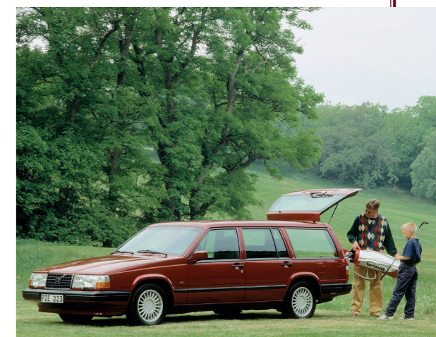
De 940 stationwagon had de grootste bagageruimte van zijn klasse.

Bij de introductie van de 700-serie had Volvo al afscheid genomen van het voor Volvo kenmerkende, inzichte-