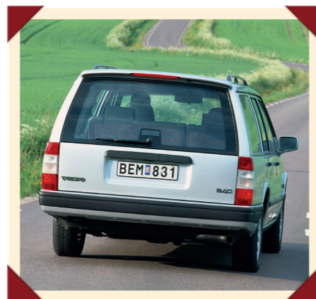
De laatste 940-modellen zijn onder meer herkenbaar aan de richtingaanwijzers met wit glas.

Bij Volvo betekent de komst van een nieuw model lang niet altijd het afscheid van een voorganger. Bij de 900-serie is dat niet anders. Wanneer de geheel nieuwe voorwielaangedreven 850 in 1991 zijn entree maakt, blijft de achterwielaangedreven 940 gewoon in productie. Zelfs na de transformatie van de 850 tot S70 en V70 in 1996 houdt hij het nog twee jaar vol. In het laatste jaar is het motorenaanbod beperkt tot een