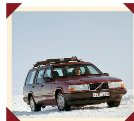
De 940 Estate voelt zich overal thuis!

lijke typeaanduidingssysteem waarbij het laatste cijfer stond voor het aantal portieren: 4 voor de sedans en 5 voor de stationwagens. Met de komst van de 900 wordt dit systeem beduidend moeilijker: het tweede cijfer verwijst niet langer naar het aantal cilinders, maar naar de marktpositionering. De 960-modellen zijn daarbij wat exclusiever dan hun 940-tegenhangers. En om de verwarring compleet te maken wordt de 940 in sommige landen ook met een zescilindermotor aangeboden, en is de 960 in andere landen juist met een viercilinder-turbomotor verkrijgbaar.