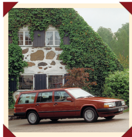
De stationwagon is wereldwijd nog altijd een populaire gezinsauto.

Niet alleen de naamgeving is verwarrend geworden. Ook de variatie in styling maakt het werk van toekomstige merkhistorici er niet gemakkelijker op. Zo wordt voor de Amerikaanse 940 anders dan bij de Europese modellen niet alleen het middendeel maar ook de neus van de oude 740 overgenomen. Voor andere afzetmarkten krijgt de 940 het front van de gefacelifte 740 turbo, of er nu een turbomotor onder de kap ligt of niet. Europese en Amerikaanse Volvo-keners raken regelmatig het spoor bijster wanneer ze tijdens een verblijf aan de andere kant van de Oceaan een 900 spotten.