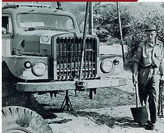
Vanwege de eenvoudige techniek vereist de TP21 maar weinig onderhoud.