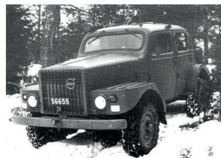
In zand of sneeuw, de TP21 voelt zich overal thuis.

Het chassis en de voor- en achterwielophanging waren afkomstig van verschillende Volvo-vrachtwagen-