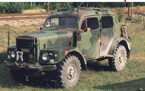
Omdat de TP21 vooral een legervoertuig was, werd hij ook met camouflagebeschildering geleverd.