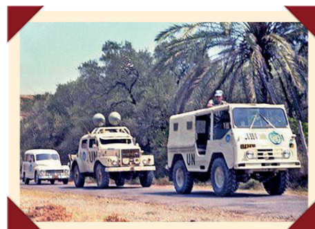
Een Volvo-trio in VN-dienst: een Duett (P210), een 'Sugga' (TP21) en een 'Valp' (L3314).

Zweden is neutraal en heeft uit hoofde van die status een defensieve strijdmacht waarvan de voornaamste taak de bescherming van het nationaal grondgebied is. Juist vanwege zijn neutraliteit is Zweden al van oudsher betrokken bij vredesmissies van de Verenigde Naties. Zo nam het Zweedse leger deel aan de UNEF (United Nations Emergency Force), de interventiemacht die na de Suez-crisis van 1956 tot 1967