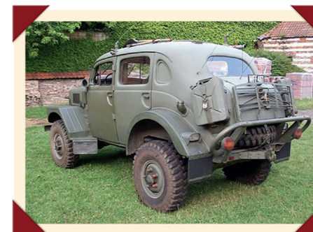
In de standaarduitrusting kon al het materiaal voor meerdaagse missies meegenomen worden.

bagagerek met daaronder een uitsparing voor het reservewiel. Ook was er plek voor twee jerrycans. Op het dak waren lange antennes gemonteerd, plus een aantal beugels waaronder gereedschap kon worden vastgezet. Ook was er een noodluik dat de inzittenden van het radiocompartiment een ontsnappingsmogelijkheid bood mocht het voertuig over de kop slaan. Om te voorkomen dat passagiers uitlaatgassen zouden inademen tijdens het opladen van de radioaccu's met de 600W-dynamo, was de uitlaat van een verlengstuk voorzien.