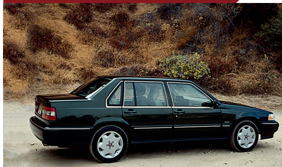
De Amerikaanse versie is herkenbaar aan de oranje positielichten aan de voorzijde en de Volvo-emblemen op de plaats van de zijrichtingaanwijzers.

Qua uitrusting boden de Volvo S90 en de V90 standaard of optioneel zo'n beetje alles wat er destijds aan comfort- en veiligheidsvoorzieningen verkrijgbaar was: interieurbekleding van leer of velours, inlegpanelen van echt hout, elektrisch verstelbare voorstoelen met verwarming, boordcomputer, cruise control, automatische airco, glazen schuif-/kanteldak, front- en zijairbags, ABS, premium hifi-systeem en zelfs – een primeur voor die tijd – een navigatiesysteem!