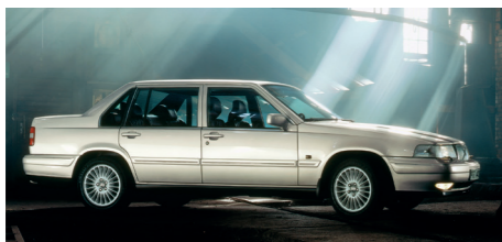
De Volvo 960: een moderne auto met een elegante uitstraling

M et de komst van de S40/V40 als vervangers van de 400-serie waarin nooit een stationwagon was verschenen, keerde Volvo in 1996 voor zijn compacte middenklasser terug naar een klassiek modelaanbod bestaande uit een vierdeurs sedan en een stationwagon. Om te benadrukken dat het om twee volkomen nieuwe modellen ging en het merk meteen ook een wat moderner imago te geven, werd tevens een nieuw modelbenamingssysteem geïntroduceerd. Volvo wilde daarbij de sedan aanvankelijk S4 noemen, en de stationwagon V4, waarbij de V stond voor Versatility , oftewel veelzijdigheid. Helaas hadden de marketeers hun huiswerk niet goed