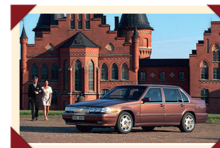
Ondanks zijn leeftijd oogde de Volvo S90 modern.

Voor de Volvo 760 en 960 waren altijd verschillende motoren leverbaar geweest, waarbij het aanbod soms per markt en naargelang de geldende milieu- en belastingwetgeving verschilde. De S90 en V90 werden echter uitsluitend nog aangeboden met de B6304S zescilinder-lijnmotor die begin jaren 1990 als vervanger van de PRV V6 was geïntroduceerd.