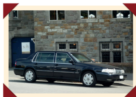
De meest luxueuze versie van de S90 Executive kreeg de aanduiding 'Royal'.

Speciaal voor hoogwaardigheidsbekleders en captains of industry die zich door een chauffeur laten rijden,