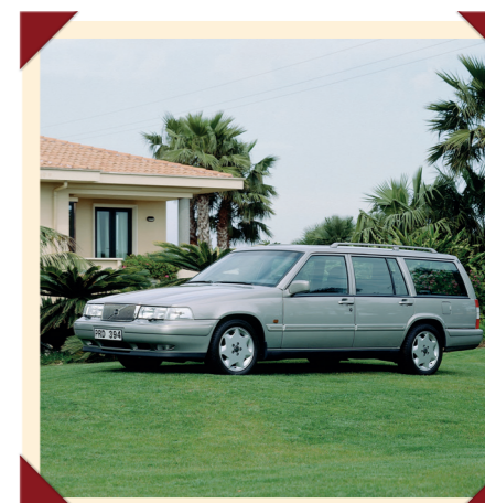
De V90 Estate is zeer zeldzaam: er werden er maar 9067 gebouwd.