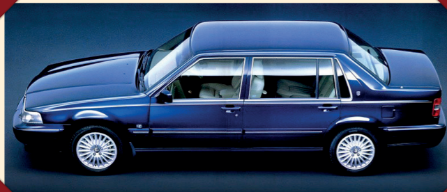
De wielbasis van de S90 Executive was met 15 cm verlengd.

bracht Volvo eveneens een extra luxe versie van de S90 uit: de S90 Executive. Dankzij de met vijftien centimeter verlengde wielbasis bood deze meer ruimte achterin, waar de standaard achterbank met drie zitplaatsen desgewenst kon worden vervangen door twee losse, zeer luxe uitgevoerde stoelen. Uiteraard waren die verwarmbaar en meervoudig elektrisch verstelbaar, waarbij zelfs een slaapbank kon worden gecreëerd. In de console tussen de beide achterstoelen bevond zich een koelkastje. De airco kon voor de achterpassagiers afzonderlijk worden geregeld en de achterraut was voorzien van een elektrisch bediend zonnescherm. Voor regeringsleiders en andere beoogde gebruikers met een verhoogd risicoprofiel kon deze Executive door gespecialiseerde bedrijven ook van bepantsering worden voorzien.