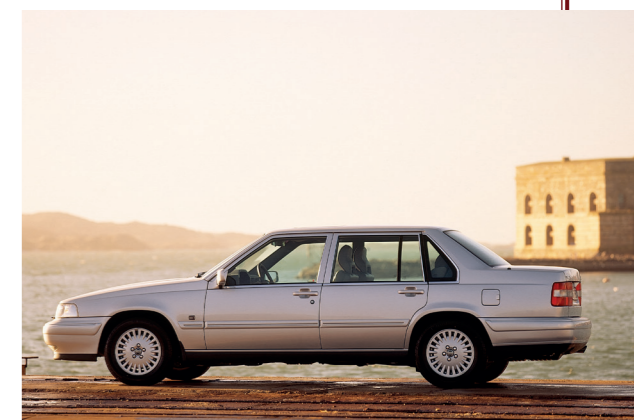
Afgezien van de naam, verschilde de laatste generatie 960 in niets van de S90.

D e S90 sedan en de V90 Estate die in 1997 in Volvo's prijslijst stonden, waren dus identiek aan de 960 die drie jaar daarvoor zijn laatste update had gehad. En feitelijk was de grote 960 op zijn beurt weer een doorontwikkeling van de 760 die begin 1982 op de markt was gebracht. Deze moderne, goed verkopende sedan was in 1988 grondig herzien. Daarbij was ook het hoekige design van zijn scherpste kantjes ontdaan, vooral aan de voorkant. In 1990 volgde opnieuw een facelift en kreeg de sedan ook een nieuwe, sterker geprononceerde achterzijde. Bij deze gelegenheid werd de naam ook meteen veranderd in 940/960, waarbij de 960 werd geïntroduceerd als exclusief topmodel met zescilindermotor. Eind 1994 kreeg die 960 een nieuwe neus met verchromde grille, waarna hij zich ook uiterlijk onderscheidde van de 940 die ongewijzigd bleef. De stationwagon behield door de jaren heen min of meer dezelfde achterzijde; alleen de bumpers en achterlichten werden vernieuwd. Alle technische wijzigingen die de sedan onderging, werden ook op de stationwagon doorgevoerd.