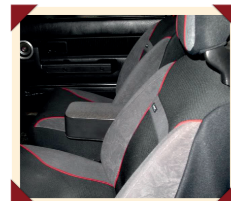
Ook sportieve stoelhoezen behoorden tot het GTX-pakket.

De 240 was afgeleid van de 140 en onderging gedurende zijn lange carrière een groot aantal veranderingen. In 1977 werden de Amerikaanse versies als eerste met een katalysator uitgerust en in 1979 maakten de ronde koplampen en grote zwarte grille van de eerste serie uit 1975 plaats voor grote rechthoekige koplampen en een smallere grille. De achterzijde kreeg grotere achterlichten. Sommige speciale uitvoeringen werden bij die gelegenheid met dubbele vierkante koplampen getooid, terwijl de exportmodellen voor de VS het moesten doen met dubbele ronde lampen aangezien gecombineerde koplampunits daar bij wet verboden waren. Eveneens in 1979 deed de dieselmotor zijn intrede, een primeur bij Volvo. Deze zelfontbrander was vooral bedoeld voor de Zuid-Europese landen. Daar worden dieselauto's niet zwaarder belast dan benzinemodellen, waardoor ze zeker in de hogere segmenten zeer in trek zijn. In 1981 werd de hele 200-serie grondig