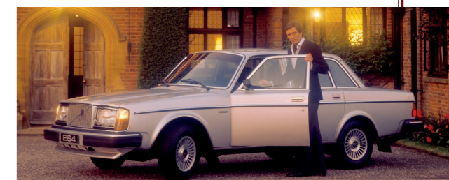
De 264 was de luxe versie in het gamma.