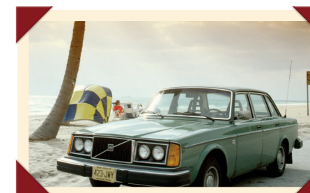
Voor de Noord-Amerikaanse markt kreeg de 244 twee dubbele ronde koplampen.

gemoderniseerd, waarbij onder andere het dashboard en wederom het front en de achterlichten werden vernieuwd. Ook de stationwagon kreeg nieuwe achterlichten. In 1983 verdwenen de luxueuze 260-modellen uit het programma ten gunste van de geheel nieuwe 760. In 1986 volgde een nieuwe facelift waarbij ook de bumpers werden vervangen. Deze opfrisbeurt ging gepaard met een verandering in de naamgeving: zowel de sedan- als de stationwagonversies zouden voortaan als 240 door het leven gaan. De 4 voor vierdeurs en de 5 voor vijfdeurs in de typeaanduiding kwamen dus te vervallen. In de laatste jaren van zijn bestaan werden op de 240-serie alleen nog technische updates doorgevoerd, voornamelijk om aan nieuwe milieuen veiligheidsnormen te voldoen. De productie van de sedan werd in 1991 stopgezet, die van de stationwagon in 1993.