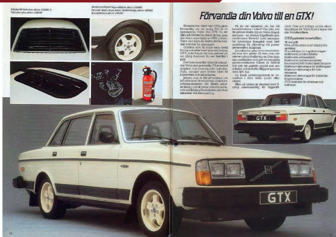
Het GTX-pakket bood een ruime keuze aan sportieve accessoires.

Het aantal uitrustingsvarianten was enorm: L (Luxe), DL (De Luxe), GL (Grand Luxe), GLE (Grand Luxe Executive), GLT (Grand Luxe Touring), GT (Grand Tourisme) en Turbo. Om de klant nog meer maatwerk te bieden, was er daarnaast een waslijst aan accessoires beschikbaar. Verder werden in sommige landen modellen in een specifieke kleur of met een bijzondere uitrusting aangeboden, zoals de 244 Blue Star en de 244 Jubileum waarmee Volvo in 1977 het vijftigjarig bestaan van het merk luister bijzette.