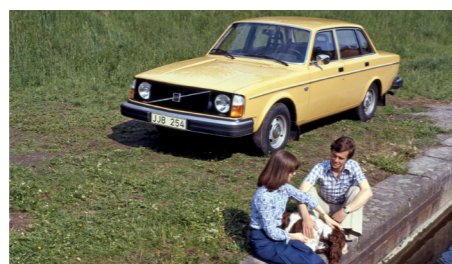
De Volvo 244 was in grote lijnen gebaseerd op de 144, maar had een modernere voor- en achterzijde.

Voor veel mensen is de Volvo 240 dé Volvo. Zijn hoekige 'schoendoosdesign', de grote bagageruimte, de degelijke maar niet té sterke motoren en het imago van 'veilig als een tank' maken hem tot de ideale Volvo, in elk geval in de periode 1970 tot de late jaren 1990: een niet te opzichtige auto die staat voor een verantwoorde keuze. Dat is niet alleen in veel Europese landen zo, maar ook in Amerika, waar hij doorgaat voor de ruimste, veiligste en milieuvriendelijkste Europese auto. Een auto die niet erg sexy is, maar die dankzij zijn compacte, relatief schone motoren zijn eigenaar neerzet als een bewust mens, die geeft om zijn eigen gezondheid en die van anderen. Toch staat de 240 in Scandinavië vooral te boek als de ideale gezinswagen. Een auto die is berekend op de barre omstandigheden van de poolwinter en tegelijk een hoog comfort- en veiligheidsniveau biedt. Een auto met een lange levensduur die ouders onbezwaard aan hun kinderen kunnen geven als ze zelf een nieuwe kopen.