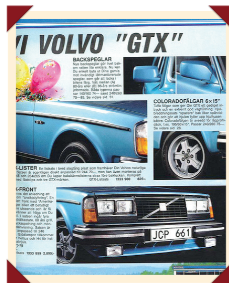
Ook na de laatste restyling bleef het mogelijk de 240 tot GTX om te toveren.

In de accessoirecatalogus stond ook een pakket waarmee de 240 sportief kon worden uitgemonteerd. Dit zogeheten GTX-pakket hoefde niet in z'n geheel te worden aangeschaft, waardoor er tegenwoordig nauwelijks twee identieke GTX-exemplaren te vinden zijn; temeer daar deze accessoires ook zeer populair waren bij de rijders van een tweedehands-240.