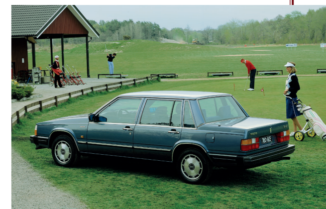
De Volvo 760 werd gepresenteerd als een elegante, moderne en luxueuze topklasse-sedan.

Als topmodel van het Volvo-gamma kreeg de 760 een V6-motor onder de motorkap. Deze van de 260 overgenomen motor was ontwikkeld in samenwerking met de Franse merken Peugeot en Renault en stond daarom bekend onder de naam PRV (Peugeot-Renault-Volvo). De interne aanduiding