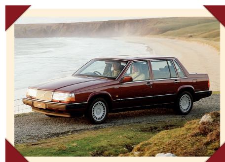
Voor dat hij 960 genoemd werd, kreeg de 760 een facelift waarbij het front van zijn meest hoekige kantjes werd ontdaan.

Hij moest eigenlijk de verouderde 240 vervangen, maar gezien diens populariteit onder een aanzienlijke groep trouwe klanten, besloot Volvo uiteindelijk beide modellen in productie te houden. In 1988 kreeg de 760 een grote opfrisbeurt, waarbij de voorzijde zijn scherpste kantjes verloor, de koplampen door modernere exemplaren werden vervangen en ook het interieur werd herzien. In 1990 ging de 760 uit productie om te worden vervangen door de nieuwe 960. In feite ging het hierbij om een veredelde facelift, waarbij het middencompartiment ongewijzigd bleef en alleen de achterzijde van de sedan vernieuwd en zichtbaar groter werd.