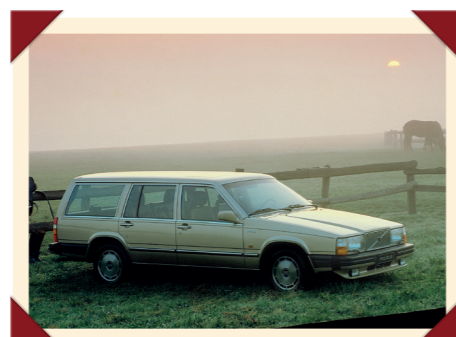
Twee jaar na de introductie van de sedan werd de 700-serie gecombineerd met de 760 Estate.

Gedurende de productieperiode werd de 760 voortdurend verder ontwikkeld. Na de komst van de Estate kwamen in 1985 nieuwe actieve veiligheidssystemen als Traction Control en ABS als optie beschikbaar. Een jaar eerder was de 700-serie al uitgebreid met de 740. Deze variant, die aan de buitenzijde herkenbaar was aan zijn zwarte grille met verchromde omlijsting, was minder luxueus uitgerust en in de meeste landen voorzien van een viercilindermotor.