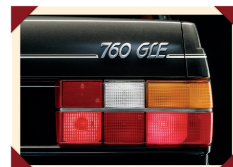
Aanvankelijk was de 760 alleen als GLE met het hoogste uitrustingsniveau verkrijgbaar.

bij Volvo was echter B28, een verwijzing naar de cilinderinhoud van 2,8 liter. Naast de V6 kwam al snel ook een viercilinder benzine-motor met turbo-compressor beschikbaar, die in 1983 gezelschap kreeg van een turbodiesel. Deze zescilinder lijnmotor met een inhoud van 2383 cm 3 werd betrokken van Volkswagen en was vooral bedoeld voor de Zuid-Europese markten, waar minder belasting op diesels werd en wordt geheven en diesels door het lagere verbruik aantrekkelijker zijn.