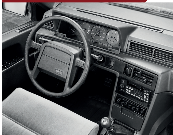
Het ergonomische dashboard was even hoekig als de carrosserie.

Wat zijn uitrusting betreft deed de 760 niet onder voor zijn sterkste Europese concurrenten. De stoelen waren bekleed met dik velours in een kleur die paste bij de carrosserie. Optioneel konden de stoelen met leren bekleding worden geleverd. Elektrische ruitbediening, airco en andere comfortvoorzieningen ontbraken evenmin. Vanaf het begin was de auto alleen verkrijgbaar met drietraps automatische transmissie met overdrive.