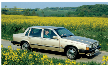
De grote zijruiten versterkten het gevoel voor ruimte in het interieur.

Kenmerkend voor Volvo waren destijds de rechte lijnen en hoekige vormen. Bij de nieuwe sedan – die werd ontworpen door Jan Wilsgaard die eerder ook verantwoordelijk was voor de 140- en 240-serie – werd die designstijl tot in het extreme doorgetrokken. Bij die uitgesproken keuze speelde ook mee dat