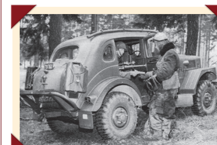
Een tussenwand met ruit scheidde de radiotelegrafist van de chauffeur.

nagestreefd. Het parool was doelmatigheid. Met zijn robuuste terreinvrachtwagenchassis en beproefde zes-in-lijn benzinemotor van de PV800 was de TP21 een uiterst effectief voertuig dat in elk terrein z'n mannetje stond. Hij was relatief compact en licht, en had een zeer hoge bodemvrijheid. Sneeuw, zand en modder boezemden hem geen angst in en zijn favoriete speelterrein waren de Scandinavische bossen.