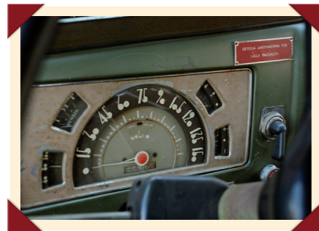
De in art-decostijl uitgevoerde snelheidsmeter detoneerde met de verder militaire sfeer.

Tussen 1953 en 1958 zijn in opdracht van het Zweedse leger niet meer dan 724 exemplaren van de Volvo TP21 geproduceerd. Daarnaast ontwikkelde Volvo een civiele versie onder de naam P2104 Special. Deze wat elegantere 4x4, die uiterlijk een beetje op de Willys Jeep Station Car leek, werd nooit in productie genomen, maar was anders waarschijnlijk een van de aller-eerste SUV's ooit geweest. Destijds was de automarkt nog niet rijp voor een dergelijk autotype.