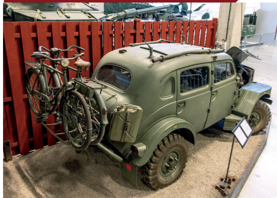
De verbindingswagen Volvo 'Sugga' was vaak uitgerust met fietsen achterop.

Niet als elk ander militair voertuig had de TP21 een spaars uitgeoefend interieur waarin alles draaide om functionaliteit. Zo was de tussenwand met ruit uit de PV830 taxi niet zonder reden overgenomen: in het min of meer afgesloten compartiment kon de radioman achterin ongestoord en in relatieve stilte zijn werk doen.