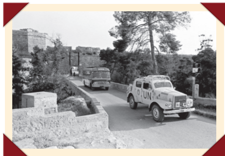
De door de Zweedse regering ter beschikking gestelde Volvo TP21 leverde ook een bijdrage aan VN-vredesmissies.

Aangenomen wordt dat minder dan de helft van de geproduceerde TP21's nog in leven is. De 'Sugga' is daarvoor een zeer gewild collector's item onder verzamelaars van klassieke militaire voertuigen. Offroad-liefhebbers die er daadwerkelijk het terrein mee ingaan, vervangen de oorspronkelijke Zweedse zescilinder lijnmotor vaak door de sterkere V8 van Amerikaanse makelij. Ook bij VN-vredesmissies zijn nog TP21's ingezet.