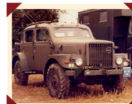
De neus van de TP21 was afkomstig van een Volvo-terreintruck.