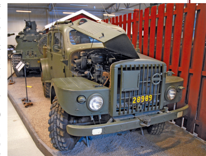
De eenvoudige en robuuste zescilinder-lijnmotor was goed toegankelijk.

Eén ding was duidelijk: een stijlvol design hadden de Volvo-ingenieurs bij het ontwerpen van het voertuig niet