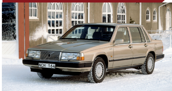
Bij de facelift van 1988 won de 760 aan elegantie.

Met de komst van de tweede generatie werd niet alleen het uiterlijk van zijn scherpste kantjes ontdaan, maar ook het dashboard, waarvan de rigide rechte vormen nu zowaar enige vorm van frivoliteit etaleerden. Een andere belangrijke noviteit was de komst van een automatische airconditioning op alle modellen: met behulp van twee sensoren in het interieur regelde dit systeem volautomatisch de luchtstroom en temperatuur in de auto op basis van de gekozen instellingen en de buitentemperatuur.