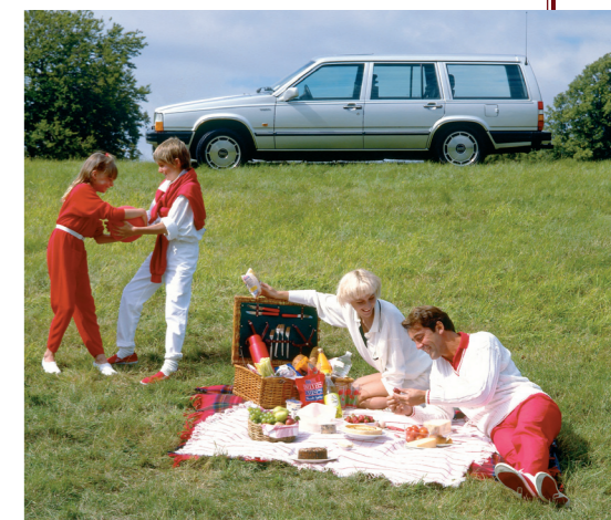
De eerste generatie 760 had nog een verticaal front.

In het najaar van 1987 kon Volvo zijn nieuwe 760 voor modeljaar 1988 presenteren. Het gemoderniseerde vlaggenschip onderscheidde zich vooral van zijn voorganger door een iets minder hoekig uiterlijk. Dit was in de eerste plaats te danken aan de nieuwe, meer in de carrosserie geïntegreerde bumpers. Ook het front was grondig herzien, met een schuingeplaatste en iets lagere grille als blikvanger. Verder waren de verchromde sierstrips rond de wielkasten verdwenen ten gunste van chroom op de flankstootlijsten en stond de auto op nieuwe lichtmetalen velgen. De sedan had een compleet nieuwe achterwielophanging van het multilink-type gekregen, maar vanwege gebrek aan ruimte moest de Estate-versie dit comfortverhogende systeem ontberen.