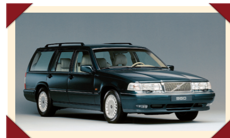
Bij de 960, de latere V90, werd de styling van de neus verder verfijnd.

De 700-serie werd in 1990 opgevolgd door de 900-serie, waarbij met name de sedan een sterk gewijzigde achterzijde kreeg. In het kader van Volvo's nieuwe typeaanduidingssysteem ging de 960 vanaf 1996 verder door het leven als S90/V90, tot de productie van deze laatste Volvo met achterwiel-aandrijving in 1998 werd beëindigd.