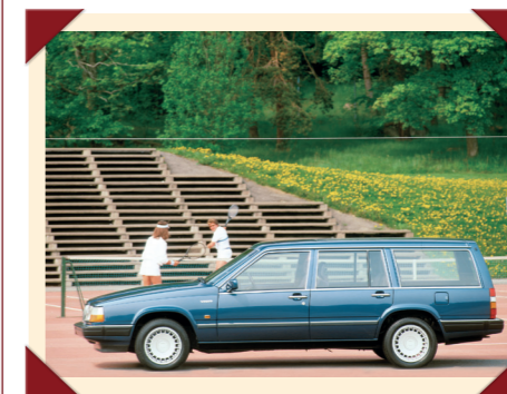
De 760 was een van de eerste Europese luxestationwagens.