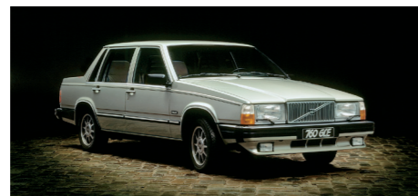
De Volvo 760 GLE sedan uit 1982.

De bij zijn introductie in 1982 nog zeer moderne 760 moest het namelijk opnemen tegen geduchte tegenstanders waaronder de nieuwe E-klasse (W124) van Mercedes-Benz uit 1985 en de eveneens nieuwe 5-serie (E34)