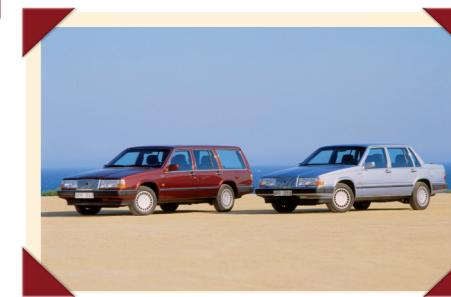
De tweede generatie van zowel de sedan als de stationwagon 760 had een vrijwel onveranderde achterzijde.

Maar er was nog een punt waarop Volvo de strijd met de concurrentie moest aanbinden. Uit diverse onderzoeken, met name die van de Duitse keuringsinstantie TÜV (Technischer Überwachungsverein), kwam naar voren dat de kwaliteit van de Zweedse