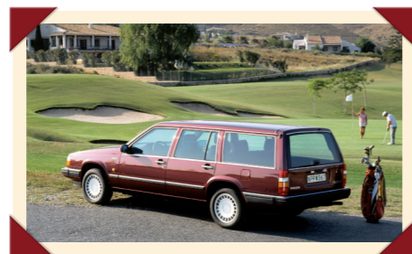
De royale 760 Estate verkocht aanzienlijk minder goed dan de sedan. De opmars van de snelle, luxueuze gezinsstationwagon moest eind jaren 80 duidelijk nog beginnen.

ook een zes-in-lijn dieselmotor en een viercilinder turbomotor beschikbaar. Deze laatste krachtbron, afkomstig uit de 740 Turbo, was vooral bedoeld voor Zuid-Europese landen waar de hoogte van de wegenbelasting afhankelijk is van de cilinderinhoud, maar vond ook op andere markten steeds meer aftrek. Vanwege zijn luxueuze uitrusting kreeg deze turbovariant de typeaanduiding 760 Turbo, al verwees de '6' daarin eigenlijk naar het cilinder aantal.