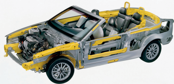
De carrosseriestructuur van de C70 was van meet af aan berekend op de bouw van een cabrioletversie.

H oewel hij minder exclusief was dan de door Bertone ontworpen en gebouwde 780 coupé, was de Volvo C70 het topmodel van de S70/V70-serie. Hij werd dan ook uitsluitend aangeboden met de motoren en de uitrustingsniveaus van de luxere modelvarianten.