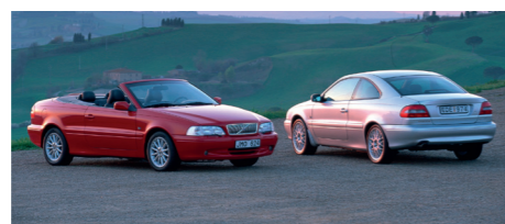
De cabriolet verscheen enkele maanden na de coupé en werd in het najaar van 1999 in Europa op de markt gebracht.

Na een positief afgesloten haalbaarheidsstudie en goedkeuring van de S70-basis, ontstond al snel het idee om naast de nieuwe coupé ook een cabriolet te gaan bouwen. Om de ontwikkelings- en productiekosten te drukken, werd deze cabriolet parallel naast de coupé ontwikkeld, een opdracht die werd uitbesteed aan TWR (Tom Walkinshaw Racing) dat voor Volvo al de racewagens voorbereide waarmee de autobouwer aan het Britse toerwagenkampioenschap BTCC deelnam.