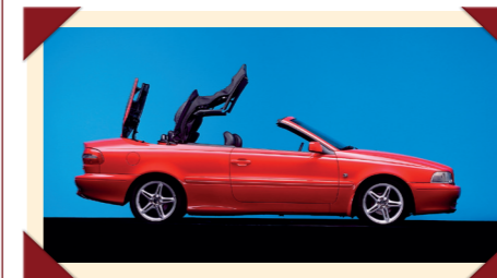
De stoffen kap kon met één druk op de knop volautomatisch worden geopend of gesloten.

De geschiedenis herhaalde zich voor de productie van de nieuwe coupé. In de jaren 1960 liet Volvo zijn P1800 coupé bouwen door het Britse Jensen en ook voor de bouw van de C70 coupé en cabriolet wendden de Zweeden zich tot een Engelse firma. Alleen vond de assemblage ditmaal plaats in Zweden. De door TWR ontwikkelde auto's werden in de Volvo-fabriek in Uddevalla gebouwd door een joint venture van Volvo en TWR. Maar toen de eerste generatie C70's eind 2005 door de tweede werd afgelost, werd het contract met TWR niet verlengd. Vanaf 2006 nam Volvo de productie volledig zelf ter hand.