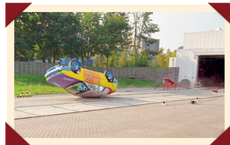
Crashtests bewezen dat ook de cabriolet een zeer hoog veiligheidsniveau bood.

wanneer de auto over de kop dreigde te slaan. Dit zogeheten ROPS-systeem (Roll Over Protection System) werd gecombineerd met een hele serie airbags en andere gangbare voorzieningen voor de passieve veiligheid zoals die ook op andere Volvo-modellen werden toegepast.