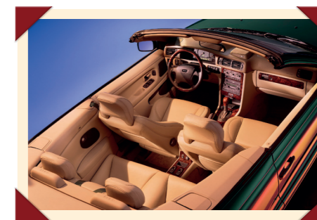
Het interieur was bijzonder luxueus afgewerkt.

namige televisieserie uit de jaren 1960 waarin de Volvo P1800 coupé furore maakte als het vervoermiddel van hoofdpersoon Simon Templar. Voor de productie van de film stelde Volvo een paar pre-seriemodellen van de C70 ter beschikking, waardoor het nieuwe model bij zijn introductie meteen volop bij het grote publiek in de schijnwerpers werd gezet. De C70, die net als zijn verre voorganger het kenteken ST 1 had, verscheen in de film in een stijlvolle brons-metallic kleurstelling met de welluidende naam 'Saffron Pearl Metallic', een kleur die ook voor de introductiecampagne van de auto werd gebruikt.