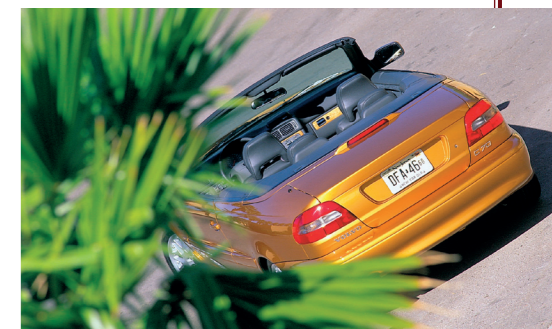
Zeker in de fraaie brons-metallic kleurstelling was de C70 cabriolet een echte eyecatcher.

De onder leiding van de nieuw aangetreden designchef Peter Horbury ontworpen coupé werd in het najaar van 1996 op de Autosalon van Parijs gepresenteerd. Als onderdeel van de S70/V70-serie kreeg de auto, die in de loop van 1997 op de markt moest worden gebracht, de typeaanduiding C70. De cabriolet maakte in januari 1997 zijn debuut op de Detroit Motor Show. Om zijn nieuwe 'image builders' onder de aandacht te brengen, maakte Volvo handig gebruik van de film The Saint die op dat moment werd uitgebracht. De film was gebaseerd op de gelijk-