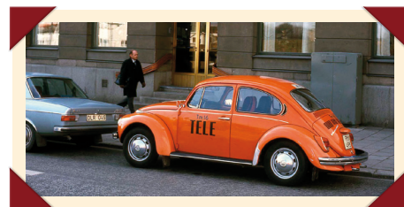
Ook de in Zweden zeer populaire Volkswagen Kever – 'Bubbla' (zeepbel) – maakte deel uit van het wagenpark van Televerket.

Net als in de meeste andere Europese landen is de Zweedse telefoniemarkt inmiddels geliberaliseerd. Televerket werd in 1993 geprivatiseerd en veranderde in Telia. Telia maakt tegenwoordig deel uit van het TeliaSonera-concern dat in 2002 ontstond uit de fusie van de Zweedse telecom-aanbieder met zijn Finse evenknie Sonera.