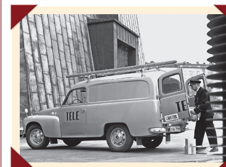
De Volvo P210 was ideaal als servicewagen. In de laadruimte kon men alles kwijt.

Volvo heeft zelf nooit een pick-up van de PV445 uitgebracht. Er zijn een paar prototypen gebouwd, maar die hebben nooit het productiestadium bereikt. Sommige importeurs, met name op het Amerikaanse continent, lieten op basis van de uit Zweden aangeleverde chassis-cabines wel eigen pick-upversies bouwen. Zo liet Volvo do Brasil een serie stijlvolle combi's bouwen in de typisch Amerikaanse 'wagon'-stijl uit die tijd. De chassis-cabine-versie verdween in 1962 definitief uit de catalogus.