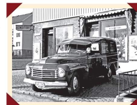
De grote zonneklep aan de dakrand bood bescherming tegen de laaghangende zon, die in de Scandinavische landen zeer verblindend kan zijn.

Het concept van een luxe stationwagon was destijds volkomen nieuw, maar bleek een schot in de roos. Sindsdien zou Volvo al zijn grotere modellen ook uitbrengen in een combi-versie, waarmee het Zweedse merk over de hele wereld naam heeft gemaakt.