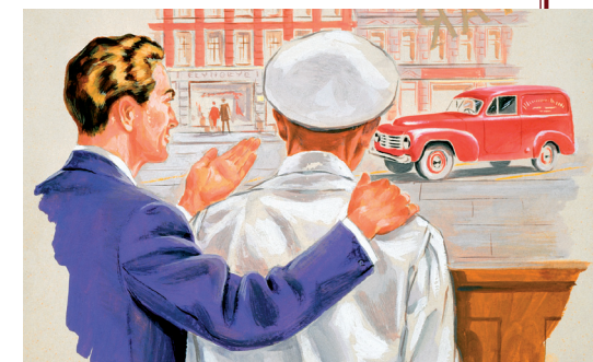
De compacte, maar ruime en praktische P210 was een ideale bestelwagen voor kleine middenstanders.

Op basis van de PV444 bracht Volvo in het najaar van 1953 twee nieuwe bedrijfswagens uit, de PV445DH (waarbij de H stond voor Herrgårdsvagn, 'herenhuiswagen') en de PV445DS (met de S voor Skåpbil, 'bestelwagen'). De goedkopere PV445DS had geen zijruiten en geen achterbank, terwijl de PV445DH aan zijn zijruiten en de uitneembare achterbank de toevoeging Duett ontleende. Vanwege het succes van deze 'combi' kwam Volvo in 1955 ook met een derde, iets minder spartaanse versie met een vaste achterbank. Deze PV445PH (waarbij PH stond voor PersonHerrgårdsvagn) kreeg anders dan de twee eerdere versies een typegoedkeuring als personenauto in plaats van een bedrijfswagenregistratie. Uiterlijk was hij herkenbaar aan zijn modernere grille die chiquer oogde dan de oude met de vijf spijlen.