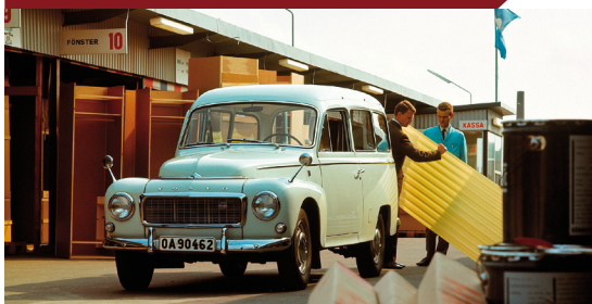
De P210 met zijruiten is beter bekend onder de naam Duett, een naam die door Volvo was bedacht om zijn dubbele karakter van zowel stationwagon als bestelwagen te benadrukken.

Bij zijn introductie was de PV445 uitgerust met de B14-motor uit de sedan. Met zijn cilinderinhoud van 1400 cm 3 bleek deze viercilinder echter te zwak voor het transport van zware ladingen. Vanaf 1958 kwam daarom de sterkere B16-motor beschikbaar en in de laatste zeven jaar van zijn bestaan als P210 ronkte Volvo's nieuwe B18 onder de motorkap. Met deze uit de Amazon afkomstige 1800-motor en alle aangebrachte verbeteringen was de Duett geheel uitgerijpt en bouwde de auto uit hoofde van zijn betrouwbaarheid en efficiëntie een zeer goede reputatie op. Ondanks dat de vraag constant bleef, zag Volvo zich toch gedwongen de productie in 1969 te staken. De nieuwe Zweedse normen voor botsveiligheid zouden namelijk teveel aanpassingen vergen om van toepassing te kunnen zijn op een aan de eind jaren 1940 ontwikkelde auto.