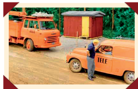
De P210 voelde zich overal thuis.

De Volvo's waren eigendom van het staatstelefoonbedrijf Televerket, dat in 1853 was opgericht onder de naam Kongl. Elecktriska Telegraf-Werket. Die naam was in 1871 veranderd in Kongl. Telegrafverket, dat in 1903 een nieuwe spelling kreeg in de vorm Kungl. Telegrafverket. De aanduiding 'Kungl.' voor koninklijk werd in 1946 geschrapt en hoewel het eerste openbare telefoonnetwerk al dateerde uit 1882, zou het tot 1953 duren voor het woord 'Telegraf' uit de naam verdween en de bedrijfsnaam werd vereenvoudigd tot Televerket.