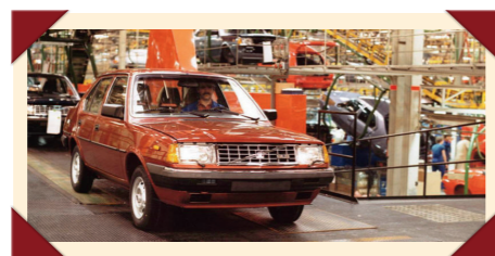
Een Volvo 360 sedan op de productielijn in Born, nu de VDL Nedcar-fabriek.

Staten. Anders dan sommige van zijn concurrenten, die niet meer waren dan een hatchback waar een stuk aan vast leek te zijn geplakt – zoals de Volkswagen Jetta –, was het design van de 360 sedan goed uitgebalanceerd. Maar natuurlijk was de grote kofferbak zijn sterkste troef, vooral ten opzichte van de hatchback-versies waarvan de bagageruimte vanwege de achterwielaandrijving een vrij beperkte inhoud had.