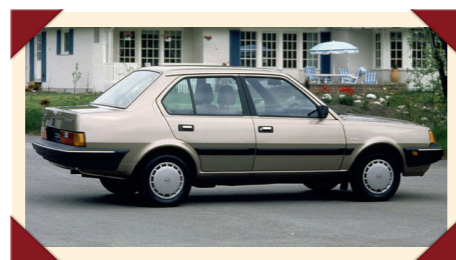
Als laatst verschenen model van de 300-serie had de 360 van het begin af aan de grote, om de hoeken doorlopende bumpers.

Geheel in strijd met de Volvo-traditie is er van de 300-serie nooit een stationwagon verschenen, al zijn er wel diverse ontwerpen gemaakt. De Volvo-directie was van mening dat de versies met een derde of vijfde deur de rol van de stationwagon wel konden vervullen en zagen geen reden om in de ontwikkeling van een aparte Estate-versie te investeren.