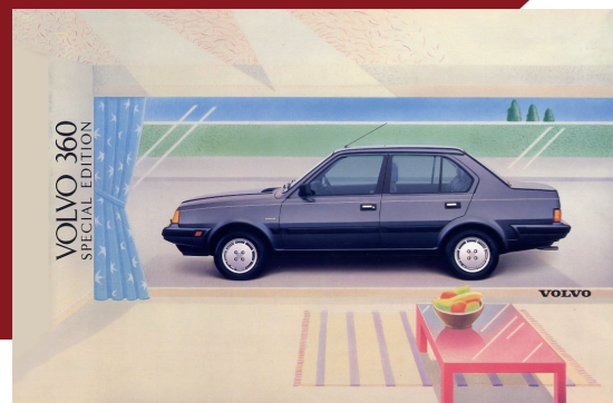
De brochure van de 360 Special Edition voor Groot-Brittannië, geheel in jaren 80-stijl.

Deze vierdeurs variant werd in 1984 op de markt gebracht onder de naam 360 sedan. De aanduiding 344 was logischer geweest, maar het jaar daarvoor was Volvo overgestapt naar een eenvoudiger typeaanduidingssysteem, waarbij geen onderscheid meer werd gemaakt naar het aantal portieren. De 343 en 345 werden volgens deze nieuwe nomenclatuur omgedoopt tot 340 en 360, waarbij het middelste cijfer niet langer het aantal cilinders aangaf, maar het luxeniveau. Waar de 340-modellen het moesten doen met een 1.4 of 1.7 Renault-motor, waren de 360-varianten uitgerust met een tweeliter krachtbron. Dit gold voor alle carrosserietypen. Verwarrend was echter dat de 240/260-serie en later de 740/760, de 260 en de 760 wel een zescilinder-motor hadden.