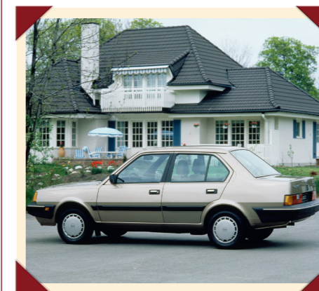
De Volvo 360 sedan heeft een sierlijker profiel en stijlvollere achterzijde dan zijn hatchback-familieleden.

Inmiddels waren de verkoopcijfers flink gestegen, wat Volvo het vertrouwen gaf om de serie verder uit te breiden. Speciaal voor de Zuid-Europese markt en de Verenigde Staten werd er een traditionele sedan met een aparte kofkerbak ontwikkeld.