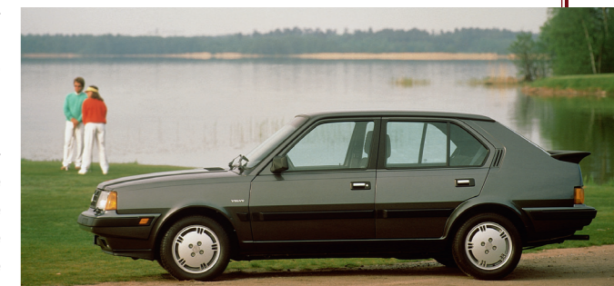
De 360, het topmodel van de 300-serie, werd ook in een vijfdeurs versie aangeboden.

Anders dan de concurrentie die destijds massaal overstapte naar voorwielaandrijving voor kleinere modellen, had de nieuwe Volvo achterwielaandrijving. Bij compacte auto's was het belangrijkste nadeel daarvan dat de forse middentunnel de zitruimte achterin beperkte. De reden dat de Nederlandse ontwerpers toch voor achterwielaandrijving hadden gekozen, was dat de als DAF ontwikkelde auto vanzelfsprekend moest worden uitgerust met het fameuze Variomatic-systeem. Toch waren trouwe Volvo-rijders, die een handgeschakelde versnellingsbak of op z'n best een conventionele automaat gewend waren, na de eerste kennismaking met de nieuwe Volvo 343 in 1976 maar matig te spreken over dit door Volvo nu CVT (Continu Variabele Transmissie) gedoopte systeem.