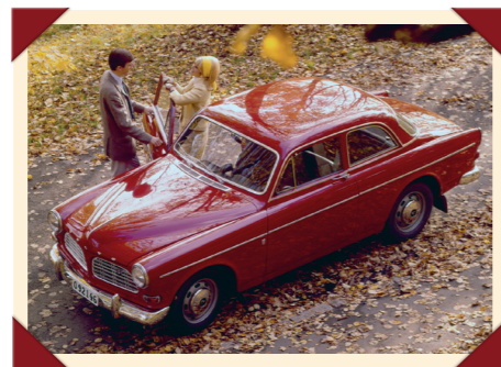
Een 123 GT zonder de extra lampen en zonder de buitenspiegels op de voorspatborden.

De marketeers van Volvo lieten daarom een tweedeurs Amazon uitrusten met de B18B-motor van de 1800S. Vanwege aanpassingen aan het uitlaatsysteem en de combinatie met een vierversnellingsbak met overdrive moest het vermogen licht worden teruggebracht tot 97 pk.