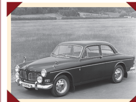
Met extra lampen en buitenspiegels op de voorspatborden was de Amazon 123 GT een sportieve verschijning.

Toen Volvo in 1970 besloot de productie van de Amazon te beëindigen, verdwenen de duurdere modellen als eerste van de prijslijst. Toch werd de 123 GT doorgebouwd voor landen waar hij nog altijd goed verkocht. Zo bleef dit topmodel van de serie in bijvoorbeeld Zwitserland leverbaar tot het moment dat de Amazon definitief uit productie werd genomen.