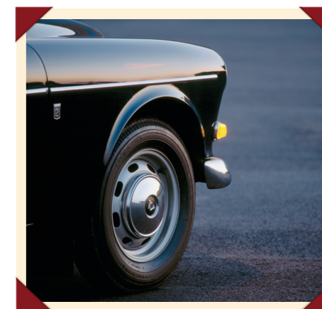
De velgen waren voorzien van stijlvolle verchroomde wielsierdeksels.

De Volvo 123 GT was al snel een commercieel succes, al werden de verkopen geremd door de hoge prijs. De 123 GT kostte 19.250 Zweedse kronen (13.450 gulden), wat hem het duurste model van de Amazon-reeks maakte. Omdat de 123 GT geen eigen type-nummer had, is het exacte productie-aantal moeilijk te achterhalen, maar algemeen wordt aangenomen dat er van de eerste serie, die met een B18B-motor in de jaren 1967 en 1968 werd geproduceerd, zo'n 1500 exemplaren zijn gebouwd.