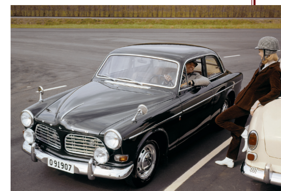
Een echte amazone mocht op de reclamefoto niet ontbreken!

Klanten hadden keuze uit drie kleuren: rood, wit (soms crème) en donkergroen, de meest gangbare kleur. In sommige landen was de 123 GT op aanvraag ook in andere kleuren verkrijgbaar: zo was in Zwitserland, waar de auto goed verkocht, metallic blauw vrij populair. In Canada stonden ook lichtblauw, zwart en lichtgroen in de catalogus. In 1968 werd het kleurenpallet voor de Zweedse thuismarkt uitgebreid met donkerblauw.