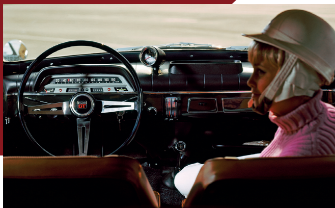
Het dashboard van de 123 GT was standaard voorzien van een losse toerenteller.