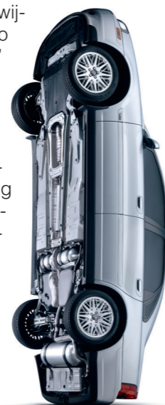
De S80 Bi-Fuel had aan weerszijden van de achteras tanks voor aard- of biogas.

turbomotor van 180 pk. Het motorengamma werd gecompleteerd door een 2,5-liter vijfcilinderdiesel van Volkswagen, die in 2001 werd vervangen door een 2,4-liter commonrail-diesel uit eigen huis.