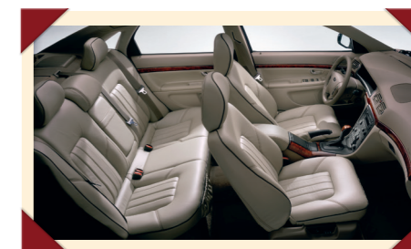
Het interieur was zeer ruim en luxueus, zeker bij de hier afgebeelde Executive-versie.

Daarnaast was de auto uitgerust met een compleet arsenaal airbags, waaronder gordijnairbags langs de zijruiten, en het van de 850 overgenomen SIPS-systeem dat bescherming biedt bij een zijdelingse aanrijding. Alle vijf zitplaatsen waren voorzien van driepuntsveiligheidsgordels met voorspanners, terwijl het inzittendencompartiment was geconstrueerd als veiligheidskooi, waarbij de motorruimte en bagageruimte fungeren als kreukelzones die de klap bij een eventuele botsing moeten opvangen ter voorkoming van letsel bij de passagiers.