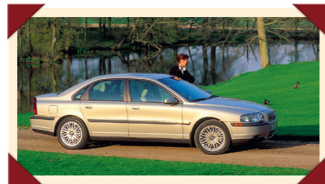
Met de S80 wilde Volvo zijn imago verjongen.

door zijn geprononceerde taillelijn ook deed denken aan de Amazon. Hiermee maakte Volvo de wereld duidelijk dat er een nieuwe designwind waaide die rigoureus afrekende met de hoekige vormen die decennialang het imago van het merk hadden bepaald. Omdat de dynamische styling allerm minst ten koste ging van de ruimte voor de inzittenden of hun bagage, werd de S80 gedoopte sedan een geduchte concurrent op de internationale automarkt, die in het algemeen gekenmerkt werd door veel aandacht voor de styling die bovendien aan de lopende band aan de laatste trends werd aangepast.