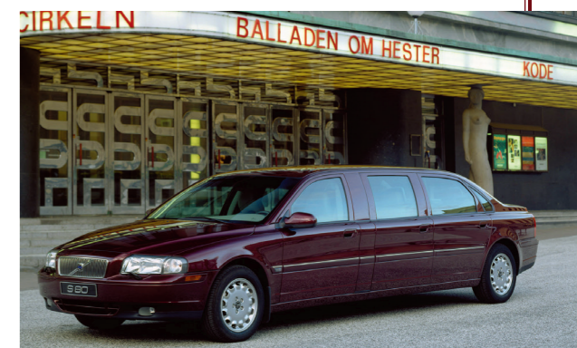
Volvo leverde ook speciale, door de Zweedse carrosseriebouwer Nilsson gebouwde versies.

Om zijn ambities in het topsegment te kunnen waarmaken, had Volvo speciaal voor de S80 een nieuwe zescilinder lijnmotor ontwikkeld. Omdat ruimte scheppen in het interieur het voornaamste doel was, werd de nieuwe krachtbron dwars voorin gemonteerd, iets waar tot dan toe geen andere autofabrikant nog in was geslaagd. Zoals het een luxesedan uit het topsegment betaamt, was deze zescilinder gekoppeld aan een automatische transmissie. De