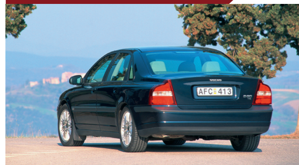
De markante achterzijde werd een van Volvo's nieuwe designkenmerken.

Sinds jaar en dag bood Volvo zijn grote sedans ook in een stationwagonvariant aan. Van de S80 zou echter nooit een combiversie verschijnen. Gelijktijdig met de invoering van het nieuwe typeaanduidingssysteem werd bekendgemaakt dat de sedan- en de stationwagonmodellen voortaan zowel technisch als stilistisch een eigen ontwikkelingspad zouden volgen. Hiermee hoopte Volvo het imago van zich af te schudden dat het bedrijf vooral 'auto's voor brave huisvaders' zou bouwen en de S80 als een echte 'executive sedan' te positioneren.