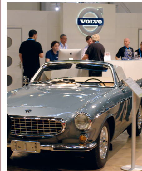
Ter gelegenheid van het 50-jarig jubileum van de P1800 werd in 2010 op de Techno Classica in Essen een P1800 Convertible van Volvoville gepresenteerd.

Overigens had Volvoville de transformatie zeer serieus aangepakt. Nu het dak ontbrak, was ter compensatie het chassis verstevigd en was de auto, ter bescherming van de inzittenden bij slecht weer, voorzien van een linnen vouwdak met daarin een achterruijze van doorzichtig plastic.