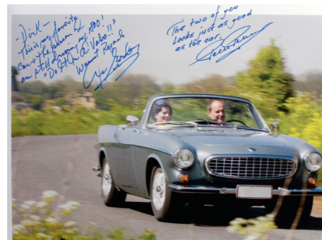
Deze foto van de P1800 Convertible is gesigneerd door Pelle Petterson, de ontwerper van de P1800, en door Irv Gordon, de Amerikaanse P1800-bezitter die met zijn in 1966 nieuw aangeschafte P1800 al meer dan 4,5 miljoen km reed.

Er was ook een keerzijde. De transformatie door Volvoville ging gepaard met een aanzienlijke prijsverhoging ten opzichte van de P1800 coupé, waardoor de productie beperkt bleef en er uiteindelijk nog geen dertig exemplaren werden gebouwd.