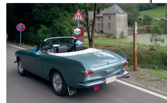
De P1800 Convertible is een ideale klassieker voor het maken van toertochten.

De P1800 cabriolet die Volvoville als 'P1800 Convertible' presenteerde, werd unaniem geprezen om zijn elegante