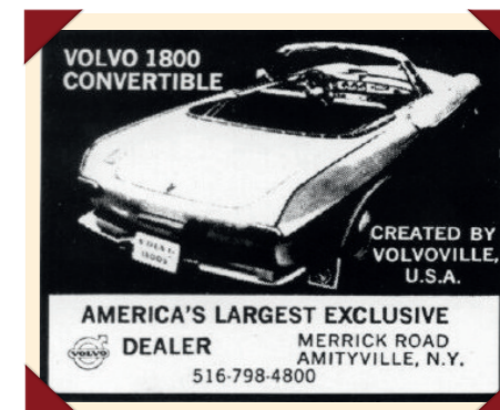
Met deze bescheiden advertentie maakte Volvoville reclame voor zijn P1800 Convertible.