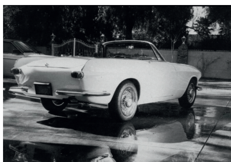
Ook zonder dak heeft de P1800 bijzonder fraaie lijnen.

Afhankelijk van het basismodel werd de auto onder de Amerikaanse naam P1800 Convertible of 1800S Convertible verkocht. In Europa, waar de aanduiding cabriolet doorgaans wordt gebruikt voor open auto's met vier zitplaatsen, werd hij meestal roadster genoemd: de achterzitplaatsen waren immers afgedekt of opgeofferd voor het vouwdak dat op geen enkele manier afbreuk deed aan de fraaie lijnen van de carrosserie.