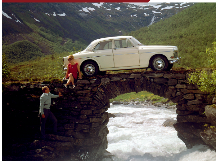
Ondanks zijn uitstraling van brave gezinsauto was de Amazon een geducht wapen in de strijd tegen de Zweedse onderwereld.

T och bleef Zweden de belangrijkste afzetmarkt voor Volvo-politiewagens. Alleen al van de Amazon werden meer dan 750 exemplaren aan de Zweedse politie geleverd. Na de overname van DAF door Volvo kwam het Zweedse merk ook bij de Nederlandse politie als leverancier in beeld. Dat begon met de in eigen land geproduceerde en daardoor relatief goedkope 340 en diens opvolger de 440. Natuurlijk voldeden die auto's aan het door de politie opgestelde eisenpakket, maar in een tijd dat staatssteun nog veel minder taboe was dan nu, zal ongetwijfeld hebben meegespeeld dat op deze manier de werkgelegenheid in eigen land een steuntje in de rug kon worden gegeven. Hetzelfde geldt voor de in Gent geproduceerde Volvo 244 die door de Belgische politie werd aangeschaft.