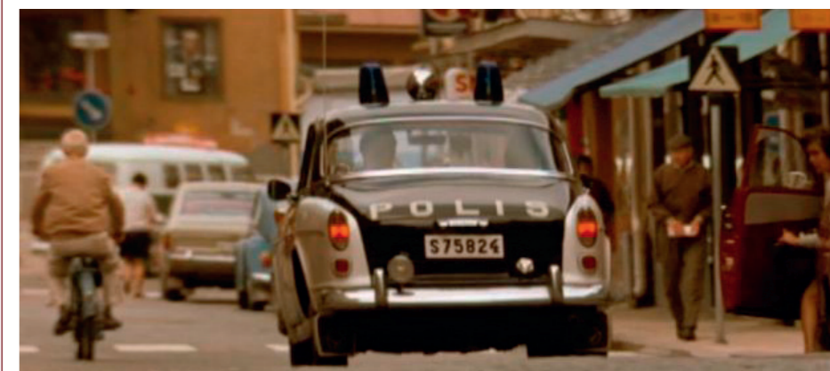
De zwart-wit beschilderde politie-Amazon was al van ver herkenbaar.

Al snel na de introductie besloot de Zweedse politie de Amazon aan te schaffen als surveillancewagen. De Amazon, die aanzienlijk sneller en ruimer was dan de PV544's die voor surveillancedoeleinden werden gebruikt, werd al snel de aangewezen vervanger van verouderde auto's van buitenlandse makelij. Toch bleven de Duett en diens opvolger, de P210, in gebruik bij de Zweedse hermandad, zij het in de geblindeerde versie voor inzet bij specifieke taken als volumetransport of onopvallende inzet.