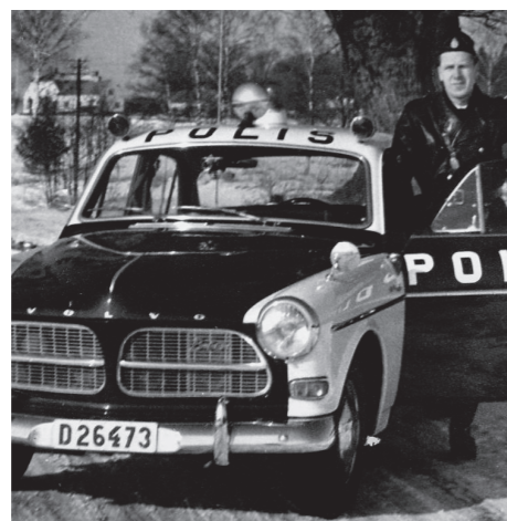
Welke agent is nou niet trots op zo'n dienstauto?

als het VW-busje. Net als in Nederland, België en Zwitserland schaften ook in Zweden verscheidene politiekorpsen aan het eind van de jaren '60 een aantal Porsches 911 aan voor het achtervolgen van snelheidsovertreders op de snelwegen.