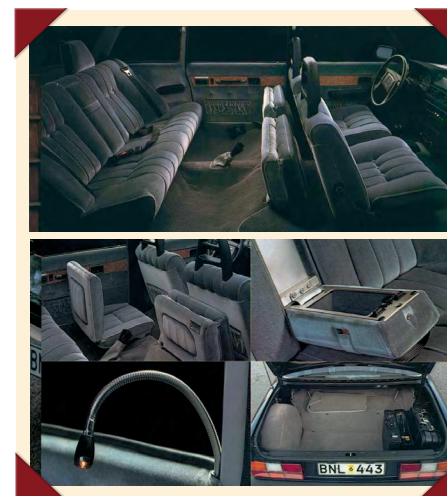
Uiteraard werden in de brochure alle bijzondere snuffjes getoond.

Meestal was de kleur statig donkerblauw, maar in de brochure werd de Volvo 264 TE, zoals de officiële naam van de auto luidde, ook aangeboden in zwart, zilvergrijs en wit. Uiteraard waren op aanvraag ook andere kleuren beschikbaar. Het interieur was bekleed met donkerblauwe of grijze velours van hoge kwaliteit en afgewerkt met inzetstukken van kostbare houtsoorten. Voor de elektrisch bedienbare ruiten hingen donkerkleurige gordijnen en een stereoradio behoorde eveneens tot de standaarduitrusting. In de optielijst stonden onder andere een kleine koelkast, een mobilfooninstallatie en andere voor die tijd geavanceerde snuffjes.