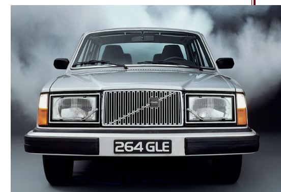
Het statige front van de 264-serie gaf de limousine een voornaam aanzien.

Z odoende ging Volvo op zoek naar een partner om zo'n verlengde versie van zijn luxesedan te laten bouwen. Omdat het hierbij voor een belangrijk deel om maatwerk zou gaan, moest dat bedrijf in staat zijn in te spelen op de eventuele speciale eisen en wensen van de afnemers. Na enig speurwerk bereikten de Zweden een overeenkomst met het Italiaanse Bertone, een bedrijf dat niet alleen een zeer goede reputatie als carrosseriebouwer en ontwerpstudio genoot, maar ook over eigen productiefaciliteiten beschikte om de auto in kleine series te kunnen bouwen.