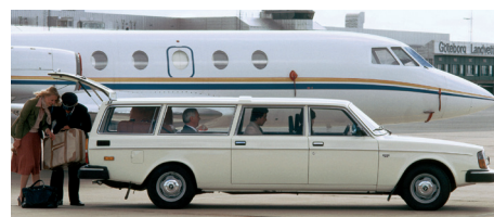
De 245 Transfer was onder andere populair als luchthaventaxi.

Hoewel de 264 TE niet als Estate in de brochure stond, werd bij Bertone wel een verlengde stationwagonversie gebouwd. Onder de naam 245 Transfer werd deze variant, die een vergelijkbaar uitvoeringsniveau had als de gewone 'korte' 245 stationwagon, geleverd aan taxiondernemingen en vervoersbedrijven die hem gebruikten als luxueus en comfortabel alternatief voor een minibus. Ook de Stasi, de