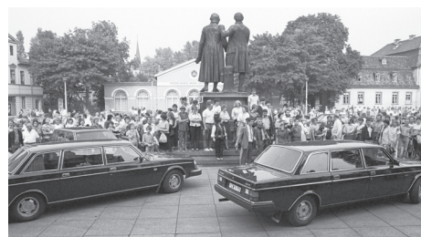
De Volvo 264 TE tijdens het bezoek van voormalig West-Duits bondskanselier Willy Brandt aan de DDR in 1985.

De Volvo 264 TE, waarbij TE staat voor Top Executive, was dus bedoeld voor de groten der aarde die kozen voor een zekere discretie en zich liever niet in een Amerikaanse, Engelse of West-Duitse limousine vertoonden. Daartoe behoorden ook de leiders van de voormalige DDR, die zich een wat moderner imago wilden aanmeten en de protserige ZIL's van