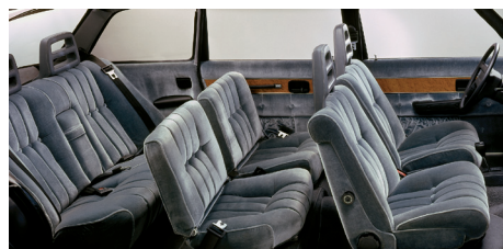
Het modulaire interieur was zeer luxueus uitgevoerd.

N a de introductie van de nieuwe 240-serie in het najaar van 1974 introduceerde Volvo zowel de 264 sedan als de 265 stationwagon als opvolgers van de 164 zescilinder. Van die sedan was nooit een Estate-versie uitgebracht, hoewel er met name vanuit de Amerikaanse markt wel vraag naar was. De nieuwe zescilinder-topmodellen hadden niet langer een zes-in-lijn-motor onder de motorkap, maar een V6, de in samenwerking met Peugeot en Renault ontwikkelde nieuwe PRV-motor. Hierdoor was het niet nodig de motorruimte van de viercilinder 240-reeks te vergroten. Uiterlijk waren de zeer compleet en luxueus uitgeruste