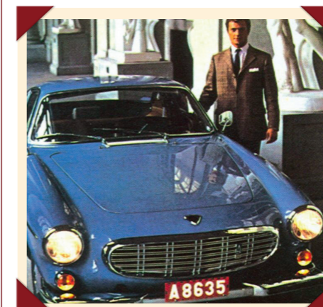
De Zweedse kroonprins poseert trots bij zijn eindexamencadeau.

Zelfs de Zweedse kroonprins Karel Gustaaf viel voor de charmes van de elegante Volvo-coupé: op twintigjarige leeftijd kreeg hij een schitterend lichtblauw exemplaar als eindexamencadeau. Het was zijn eerste auto en sindsdien heeft de latere koning van Zweden altijd een zwak voor sportieve coupés gehouden. Die eerste P1800 kreeg dan ook al snel gezelschap van nieuwe exemplaren, later gevolgd door een 1800E en een 1800ES met een zeer fraaie goudmetallic carrosserie en uitgerust met een lederen interieur in een bijpassende