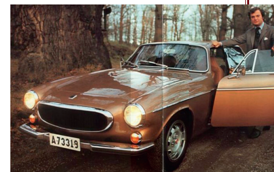
De toekomstige koning van Zweden met zijn nieuwe 1800ES.

kleur. Niet lang daarna, op 15 september 1973, werd de prins na het overlijden van zijn grootvader Gustaaf VI Adolf de nieuwe koning van Zweden.