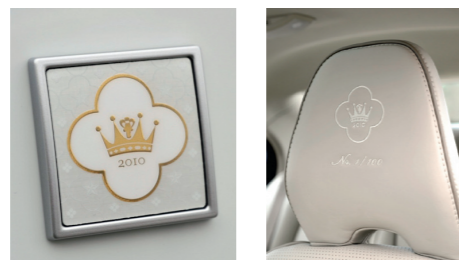
De hagelwitte S80's voor het huwelijk van prinses Victoria waren voorzien van diverse koninklijke details.