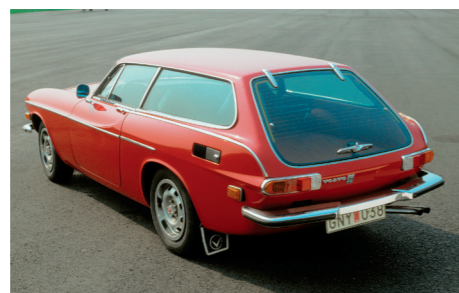
De 1800ES voor de Amerikaanse markt is onder andere herkenbaar aan de zijmarkeringlichten.

N aast auto's voor de privéloten van diverse vorstenhuizen over de hele wereld, leverde Volvo ook speciale series voor officiële aangelegenheden. Zo stond er bij de inhuldiging van Willem-Alexander op 30 april 2013 voor de Koninklijke Stallen in Den Haag een formatie van vijftien donkerblauwe S80's klaar voor het vervoer van de koninklijke gasten.