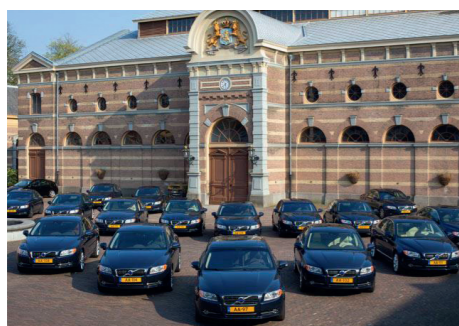
De vloot S80's voor de inhuldiging van Willem-Alexander voor de Koninklijke Stallen in Den Haag.

Met dank aan de Zweedse neutraliteitspolitiek en de ingetogen styling van zijn modellen, is Volvo van oudsher sterk vertegenwoordigd in de wagenparken van ambassades, regeringsleiders en internationale organisaties in alle delen van de wereld. Met specifieke aanpas-