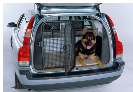
De grote Volvo stationwagon is ook ideaal voor hondenbrigades!

Voor dat laatste doel werd aanvankelijk gebruikgemaakt van motorfietsen. Toen de korpsleiding eind jaren 1950 voor de surveillancetaken op het in hoog tempo uitbreidende snelwegennet op