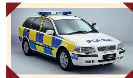
De V40 was voor de meeste Nederlandse korpsen te duur, maar werd elders wel veel als politiewagen gebruikt, onder andere in Engeland.

Een ander pluspunt was dat hij vijf deuren had in plaats van drie. Dat maakte het in geval van nood een stuk makkelijker om met vier man in de auto te springen dan bij zijn voorganger. Dat die als drie-deurs 343 door verschillende korpsen uit het hele land was aangeschaft, had