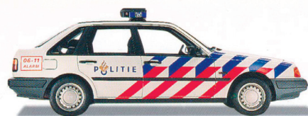
De 440 in de BZK-stripping die werd ingevoerd bij de samenvoeging van de gemeente- en de rijkspolitie in 1993.

De verre voorvader van de 440, de DAF 55, was al voorzien van een viercilinder Renault-motor, en sinds de vroege jaren 1970 werkten de Zweden met de Franse constructeur samen in het PRV V6-project. Ook de motoren voor de 340 en 360 waren afkomstig van Renault. Voor de 400-serie werd die samenwerking voortgezet. Aangezien de Variomatic-transmissie volledig kwam te vervallen, werden voortaan voor alle modelversies de motoren en versnellingsbakken uit Frankrijk betrokken.