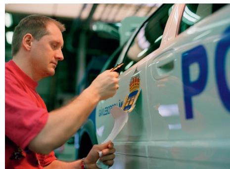
Volvo leverde aangepaste versies voor politie-inzet af fabriek.

In totaal hebben ruim vijfhonderd Porsches bij de Nederlandse politie dienst gedaan. Toen de laatste in 1995 uit dienst werd genomen, hadden de agenten al lang geen problemen meer met een dak boven hun hoofd en dus konden de Duitse sportwagens zonder ophef worden afgelost door snelle grote Volvo's, zoals de V70 stationwagens die tot op de dag van vandaag de orde op de snelwegen handhaven.