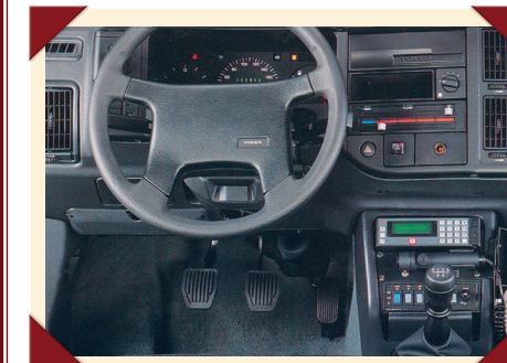
De middenconsole bevatte alle onmisbare communicatie-apparatuur.

Als vervanger van de 400-serie kwam Volvo met de S40 sedan en V40 stationwagon, maar dat waren auto's van een beduidend hogere klasse. Voor veel gemeentelijke korpsen ging dat een stapje te ver en veel 440's kregen dan ook geen Volvo als vervanger maar wat modaler modellen als de Volkswagen Golf en Opel Astra, auto's waarmee ze voorheen vaak de politiegarage broederlijk hadden gedeeld. Sommige korpsen kozen zelfs voor 'downsizing' met kleinere modellen als de Opel Corsa en Volkswagen Polo.