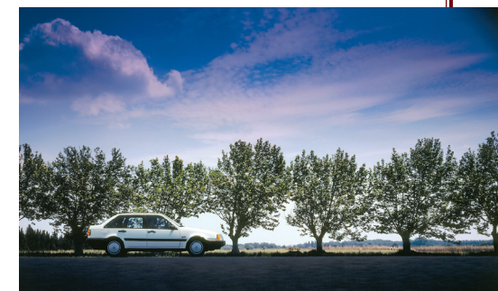
De standaard Volvo 440 was een ideale basis voor ombouw tot politiewagen.

Vaak werd gekozen voor auto's van Duitse makelij, en meer in het bijzonder van Volkswagen, maar na de overname van DAF door Volvo kwam ook de in eigen land geproduceerde 340 nadrukkelijk in beeld. Diens DAF-voorgangers