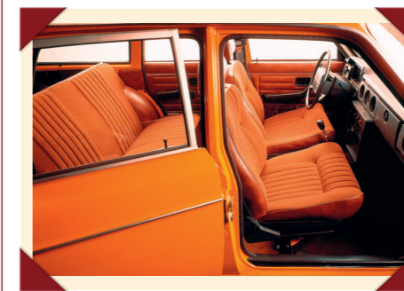
Het interieur van de Express met zijruiten was gelijk aan dat van de gewone 145 stationwagon.

Maar de nieuwe Volvo 145 Express was meer dan zomaar een 145 stationwagon met verhoogd dak. Volvo bood het model aan in een groot aantal varianten, waaronder versies met en zonder zijruiten. Bij die laatste uitvoeringen waren de achterste zijruiten vervangen