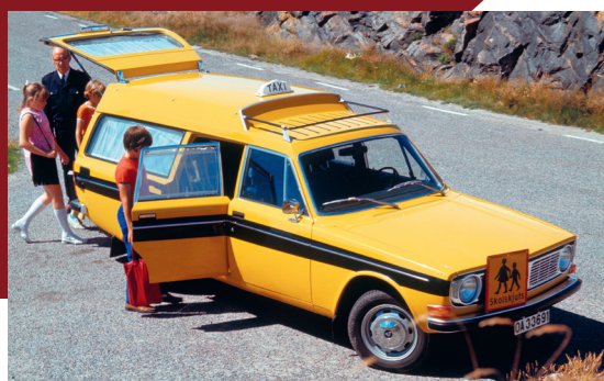
De 'schoolbus'-variant was een alledaagse verschijning op het Zweedse platteland.

Volvo heeft altijd kleine bestelwagens in zijn aanbod gehad. De eerste Volvo-vrachtwagen was niet meer dan een variant op de eerste personenauto van het merk, de ÖV4 'Jakob'. Ook daarna waren de bedrijfswagens direct gebaseerd op de personenauto's: doordat die op een apart chassis werden gebouwd, konden ze gemakkelijk van een andere carrosserie worden voorzien. Naarmate de vraag naar laadruimte en laadvermogen groeide, werden de vrachtwagens steeds meer als afzonderlijk voertuig ontwikkeld en verhuisde de productie ervan naar aparte fabrieken.