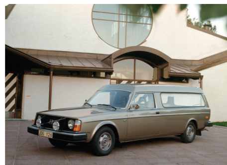
Als opvolger van de 145 bood de 245 ook een goede basis voor ombouw voor specifieke doeleinden, bijvoorbeeld tot lijkwagens.

In 1999 werd de scheiding tussen de bedrijfswagentak en de personenautodivisie van Volvo definitief toen moederbedrijf Volvo AB de automobieltak overdeed aan het Amerikaanse Ford. Onder druk van de financiële crisis deed Ford het Zweedse bedrijf in 2010 op zijn beurt over aan het Chinese Geely-concern, dat met nieuwe investeringen en het aanboren van nieuwe markten het voortbestaan van het merk zeker stelde. Volvo AB concentreerde zich na de splitsing op de bedrijfswagenmarkt en kocht onder andere de vrachtwagendivisie van Renault en de Amerikaanse truckbouwer Mack.