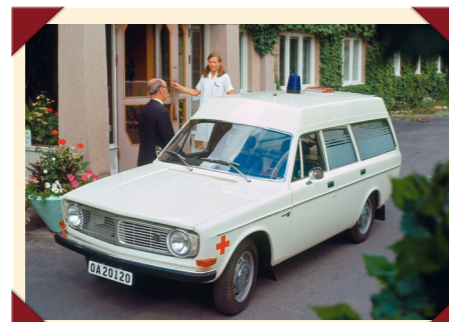
De ambulanceversie had een over de gehele lengte verhoogd dak.

Door zijn bouwwijze op een robuust los chassis was het op zich gemakkelijk geweest de Duett van een nieuwe opbouw te voorzien. Motorisch was de auto namelijk nog altijd up-to-date, omdat Volvo hem altijd had laten meeprofiteren van de modernisering voor de PV544 sedan. Maar technisch was de auto volkomen verouderd en vooral de veiligheid kon niet meer op het niveau worden gebracht waarmee Volvo zich wilde onderscheiden.