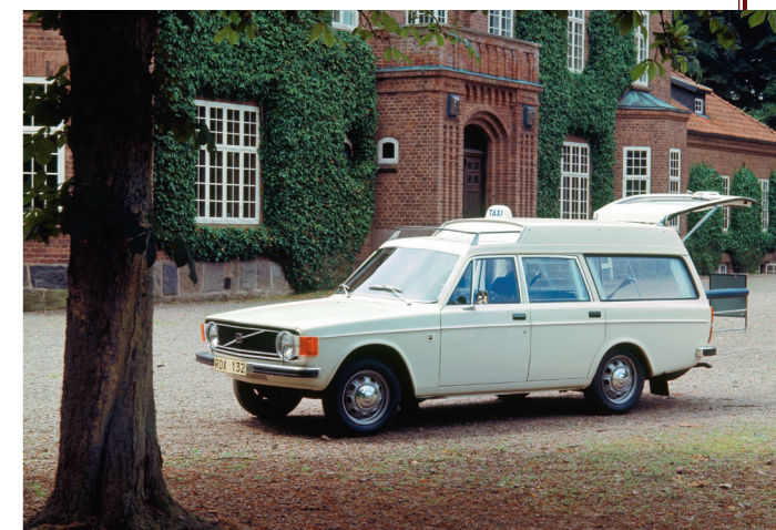
Een taxiversie met het nieuwe front van 1973.

door plaatstaal. Voor het interieur kon worden gekozen uit versies met of zonder achterbank en daarnaast waren er speciale uitvoeringen die waren ingericht voor het vervoer van schoolkinderen of als taxi.