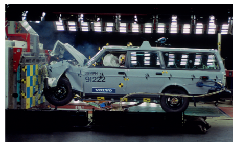
Volvo blijft werken aan een steeds betere en een steeds veiligere auto.

De laatste serie met speciale uitrusting wordt als Polar op de markt gebracht, waarbij de naam 240 komt te vervallen. In 1993 valt na bijna een miljoen exemplaren echter ook het doek voor de 240 stationwagon en loopt het laatste exemplaar van de band, een blauwe Polar Italia die regelrecht naar het Volvo-museum in Göteborg gaat.