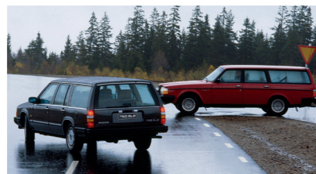
Het lukte de 740 niet de 240 stationwagon met zijn trouwe klantenkring van de troon de stoten.

en 740-serie neemt de stationwagon een steeds groter deel van de verkopen voor zijn rekening ten nadele van de sedan. Vooral onder kleine zelfstandigen en gezinnen met jonge kinderen blijft de vijfdeurs versie een bestseller vanwege zijn grote en praktische laadruimte en voortreffelijke rijeigenschappen. In 1990 overtreft de stationwagon de vierdeurs versie zelfs in productie-aantal en wanneer de sedan in 1992 uit productie gaat, wordt de estate nog doorgebouwd.