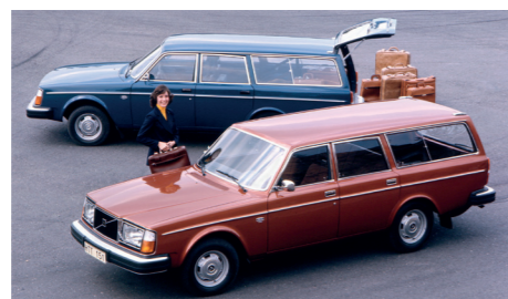
De stijlvolle en ruime 245 was een stuk moderner dan de 145.

In 1974 moderniseert Volvo de gehele 140-serie die voortaan als 240-serie door het leven zal gaan. Zoals voorheen zijn er drie carrosserievarianten: de vierdeurs sedan 244, de tweedeurs sedan 242 en de vijfdeurs stationwagon 245 (met de achterklep als vijfde deur). Het inzittendencompartiment is identiek aan het middendeel van de 140-serie, maar de neus van de auto is nieuw ontworpen en loopt nu aan de voorzijde iets naar beneden af. Onder de motorkap liggen nieuwe motoren en ook de wielophanging is vernieuwd. De belangrijkste innovaties liggen echter op het gebied van de veiligheid: van de conceptauto's van het VESC-project (Volvo Experimental Safety Car) zijn onder andere de dikke bumpers en de naar de carrosseriefanken doorlopende richtingaanwijzers overgenomen. Lang niet iedereen ziet deze nieuwe veiligheidsvoorzieningen als een esthetische aanwinst, maar anderen waarderen juist het logge tankachtige design dat in de daaropvolgende jaren tot Volvo's handelsmerk zou uitgroeien.