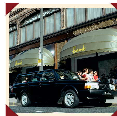
In de turbovariant werd de stationwagon zo waar een sportieve auto.

Na de introductie van de 700-serie in 1982 neemt Volvo afscheid van het systeem met specifieke typeaanduidingen voor de afzonderlijke carrosserievormen. Wel blijft het onderscheid in motorisering in de benaming gehandhaafd: voortaan wordt de auto dus alleen nog als 240 en 260 aangeboden.