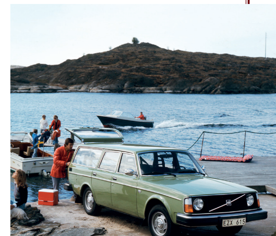
De eerste versie van de 245 had nog ronde koplampen.

De compacte en relatief lichte diesel liep bijna even rustig als een benzinemotor, maar bood als voordeel een aanzienlijk groter koppel, een veel soepeler karakter en een flink lager brandstofverbruik. Dat maakte deze krachtbron ideaal voor de stationwagon, die vaak zwaar wordt beladen en voor lange ritten wordt gebruikt. De nieuwe dieselvarianten komen precies op het juiste moment om de door de tweede oliecrisis wat wegzakkende verkopen weer een impuls te geven. In Europa groeit de populariteit van dieselmotoren sterk en ook in de Verenigde Staten begint men de dieselmotor als een serieus alternatief te zien: zelfs Cadillac komt in 1979 met een dieselvversie van zijn Seville.