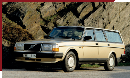
Na twintig jaar oogde de 240 stationwagon allerminst gedateerd.

Tien jaar na zijn debuut in 1984 verkoopt de Volvo 245 beter dan ooit: dat jaar lopen er 86.000 exemplaren van de band. Terwijl de autoverkoop in heel Europa zwaar onder druk staan, weet Volvo de wind in de zeilen te houden dankzij zijn goede verkopen in Amerika en een sterk merkimago. Net als zijn binnenlandse concurrent Saab heeft het bedrijf uit Göteborg een zeer goede reputatie opgebouwd op het gebied van robuustheid en veiligheid, waarbij beide Zweedse fabrieken toch hun eigen stijl en karakter hebben weten te behouden.