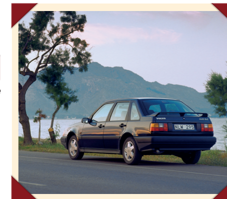
Als compacte hatchback maakte de 440 het Volvo-programma compleet.

Om de ontwikkelings- en productiekosten laag te houden betrok Volvo de motoren voor de 440 van Renault, net als voor de 480. Bij zijn introductie was de 440 zodoende leverbaar met het