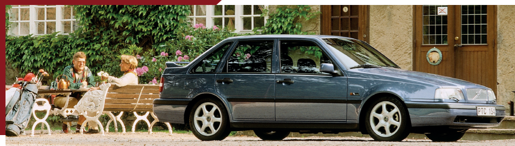
De laatste versie voordat de 440 in 1996 uit productie werd genomen.

In 1989 werd de 400-serie verder uitgebreid met de 460. Nadat meerdere voorstellen waren afgevoerd, koos de Volvo-directie uiteindelijk voor dit rechttoe-rechtaan model dat op basis van de bestaande hatchback relatief eenvoudig te produceren was. Als traditionele sedan moest de 460 met zijn wat chiquer ogende chroomkleurige grille de positie van Volvo op de Zuid-Europese markt verstevigen, waar evenals op de Scandinavische thuismarkt van oudsher meer vraag bestaat naar auto's met een aparte kofkerbak.