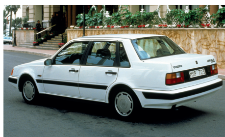
Met de sedanversie 460 mikte Volvo op een wat behoudendere clientèle.

Het lag in de lijn der verwachting dat Volvo – hét stationwagonmerk bij uitstek – ook een Estate in de 400-serie zou uitbrengen. Bij de ontwikkeling van