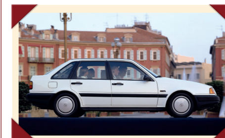
Ook in de basisuitvoering was de 440 een ruime en stijlvolle middenklasser.

1721cc-blok van de 480, met en zonder turbo. De basisversie GL had al een vrij complete standaarduitrusting, maar wie wat meer wilde koos voor de GLT die onder andere was uitgerust met een spoiler op de achterklep. De turboversie had net zo'n spoiler, maar onderscheidde zich met andere sportieve details als lichtmetalen velgen. Verder had deze potente variant hetzelfde geavanceerde elektronische injectiesysteem als de 480, al was het anders afgeregeld om het motorvermogen omlaag te brengen en de betrouwbaarheid ten opzichte van de eerste versies van de coupé te vergroten.