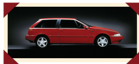
De turboversie van de stijlvolle coupé 480.

In maart 1986 verraste Volvo de autowereld door op de Autosalon van Genève eerst de coupé als nichemodel te introduceren. Door zijn moderne concept en styling vormde deze 480 een breuk met het verleden: het was de eerste Volvo met voorwielaandrijving. Juist om die reden hield Volvo de beoogde opvolger van de 340 en 360 nog even op de plank: alles was nieuw aan de 400-serie en eventuele kinderziekten en kwaliteitsproblemen zouden veel gemakkelijker te verhelpen zijn bij de in relatief kleine aantallen geproduceerde