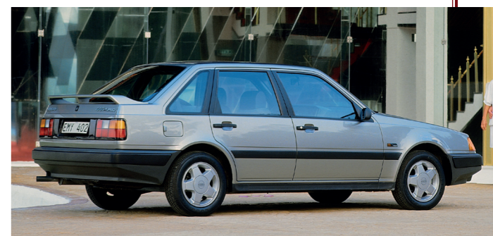
Zoals bij meer auto's in die tijd was de turboversie het topmodel.

A ls opvolger van de 300-serie werd de 440, net als de 480, gebouwd in de voormalige DAF-fabriek in Born. Daardoor kon Volvo zijn auto's vrij van importheffingen verkopen in alle landen van de EEG, de voorloper van de Europese Unie waarvan Zweden in die tijd nog geen deel uitmaakte. Omdat de