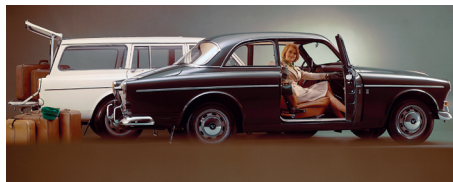
De Kombi voegde aan de klasse van de tweedeurs sedan een forse dosis praktisch gebruiksgemak toe.

De stijlvolle carrosserie van de Kombi die Volvo in februari 1962 op de auto-beurs van Stockholm presenteerde, was duidelijk geïnspireerd op de Amerikaanse station wagons uit die tijd.