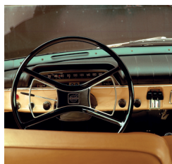
Het interieur was even compleet en luxueus als bij de sedan.

aan de rechterkant van de weg. Om te voorkomen dat zijn traditiegetrouw in augustus gepresenteerde modellen-nieuws volledig ondergesneeuwd zou raken in alle media-aandacht voor deze ingrijpende gebeurtenis, besloot Volvo zijn modellen voor 1968 in Noorwegen en Denemarken aan de internationale pers te tonen. Los van alle drukte in Zweden, wist het bedrijf uit Göteborg zo toch de nodige publiciteit te genereren voor de reeks nieuwe veiligheidsvoorzieningen voor zijn Amazon-reeks, waaronder een gedeelde stuurkolom en een bij een botsing vervormbaar veiligheidsstuurwiel.