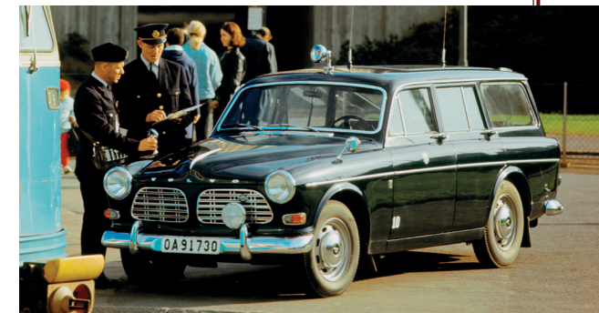
Ook de Zweedse politie maakte graag gebruik van de Kombi.

Extra ruimte kon ook worden verkregen door de achterbank neer te klappen: zo ontstond er een regelmatig gevormde laadruimte met een lengte van 183 cm en een breedte van 126 cm. Dankzij de twee robuuste kokerbalken waarop het nieuwe achterdeel van de carrosserie steunde, bedroeg het nuttig laadvermogen 490 kg.