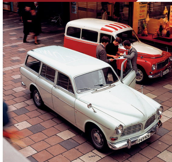
Naast de Amazon P220 hield Volvo lange tijd ook de eenvoudigere Duett in het aanbod.

H oewel in Zweden links werd gereden, hadden Volvo's van oudsher het stuur links. De Amazon was het eerste model dat voor exportmarkten als Groot-Brittannië en Australië ook leverbaar werd in een rechtsgestuurde uitvoering. Aan het einde van zijn carrière besloot Zweden echter over te schakelen naar rechtsrijden om in de pas te lopen met zijn buurlanden. Na meer dan dertig jaar discussie was het op 3 september 1967 zover en reden de Zweden voortaan