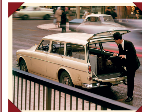
Dankzij de in twee delen te openen achterklep was de royale laadruimte makkelijk toegankelijk.

De achterklep kon overeenkomstig de Amerikaanse mode in twee delen worden geopend. Het ruitgedeelte kon daarbij naar boven worden opengezet, terwijl het onderste deel naar beneden kon worden geklapt. In die stand fungeerde de klep als verlenging van de laadvloer om het vervoer van lange voorwerpen mogelijk te maken.