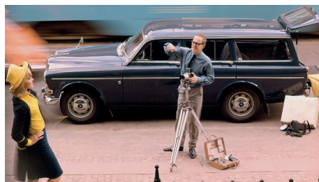
De stationwagon is niet alleen handig in gebruik, hij is ook heel stijlvol.

H oewel in Zweden links werd gereden, hadden Volvo's van oudsher het stuur links. De Amazon was het eerste model dat voor exportmarkten als Groot-Brittannië en Australië ook leverbaar werd in een rechtsgestuurde uitvoering. Aan het einde van zijn carrière besloot Zweden echter over te schakelen naar rechtsrijden om in de pas te lopen met zijn buurlanden. Na meer dan dertig jaar discussie was het op 3 september 1967 zover en reden de Zweden voortaan