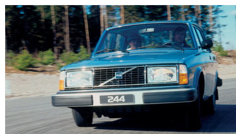
In 1979 kreeg de rest van de 240-serie een nieuw front met rechthoekige koplampen.

Bij de model-update van 1978 krijgt de rest van het gamma een nieuwe grille