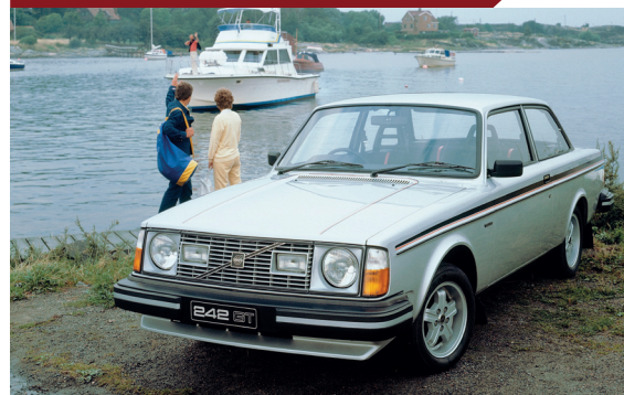
Tegen het einde van de productieperiode kreeg de 242 GT andere velgen.

Maar het Volvo-publiek laat zich door een paar strepen niet in de luren leggen. Potentiële kopers hebben goed door dat het sportieve karakter van de GT beperkt blijft tot de naam en wat decoratie, en laten het afweten. In 1978 grijpt Volvo de vernieuwing van het modelprogramma aan om de GT uit te rusten met de nieuwe B23E-motor. Met zijn grotere cilinderinhoud is deze krachtbron goed voor 142 pk en flink wat meer koppel, zodat de 242 GT zijn sportieve aspiraties nu wel waar kan maken.