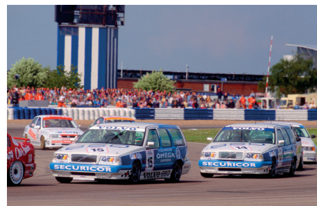
De Volvo 850-stationwagens in actie in het BTCC van 1994, met Rickard Rydell en Jan Lammers achter het stuur.

en rechthoekige koplampen, maar de 242 GT behoudt zijn eigen front met ronde koplampen, grille in carrosseriekleur en geïntegreerde mistlampen. Het nieuwe kofferdeksel met grotere opening wordt wel overgenomen van de vernieuwde standaardmodellen. In 1981 wordt de 240-serie opnieuw onder handen genomen en verdwijnt de 242 GT uit het aanbod ten gunste van de wat discretere maar aanzienlijk sterkere Turbo-versie.