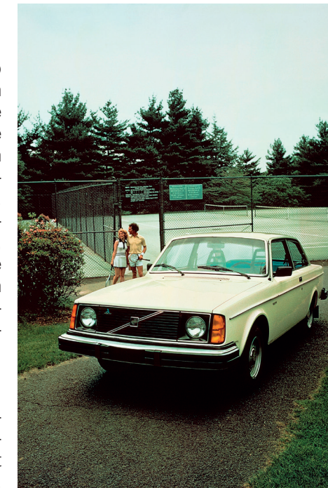
De basisversie van de 242, hier met Amerikaanse koplampen.

Ondanks zijn naam en sportieve uitmonstering verschilt de 242 GT technisch nauwelijks van de eveneens dat jaar uitgebrachte luxueuze GL-versie. Zo zijn beide modellen uitgerust met