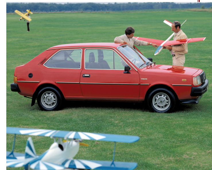
De 343 werd in de markt gezet als een veelzijdige auto.

men vindt de motor te licht en het brandstofverbruik te hoog, wat vooral wordt toegeschreven aan de CVT-versnellingsbak. Wel te spreken is men over de door de gunstige gewichtsverdeling stabiele wegligging, het comfortabele interieur en de rijke standaarduitrusting.