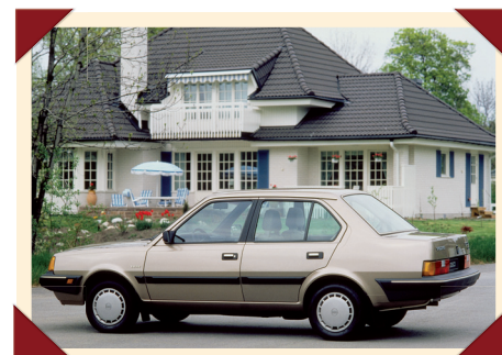
De vierdeurs sedan oogde traditioneler.

Volvo 340 van band. En vanwege zijn robuustheid en goede wegligging kiezen behalve de rijkspolitie ook steeds meer andere Europese korpsen voor de compacte Volvo. Zelfs in landen als Indonesië en Maleisië kan de 340 in politie-uniform worden aangetroffen. Na het stopzetten van de productie van de 360 en de vierdeurs sedan in 1989, verlaat in 1991 de laatste 340 de fabriek in het Limburgse Born. In totaal is er dan een respectabel aantal van 1.139.689 exemplaren van de Nederlandse Volvo gebouwd.