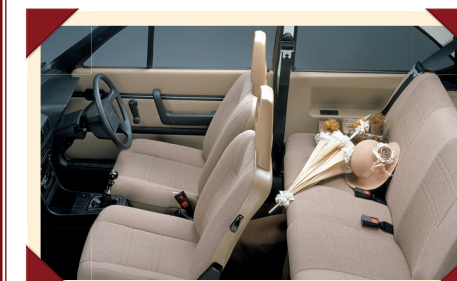
Het interieur bood veel luxe, maar door de transmissietunnel was de ruimte achterin voor volwassenen vrij krap.

CVT: Continu Variabele Transmissie. Anders dan zijn directe concurrenten heeft de Volvo 343 achterwielaandrijving, waarbij de versnellingsbak bij de achteras is geplaatst. Daardoor staat de achterbank vrij hoog. De eerste modellen zijn leverbaar in opvallende kleuren en hebben een typisch jaren-70-interieur. Vanwege het als te gering ervaren motorvermogen van 70 pk wordt de auto door de pers niet erg positief ontvangen: