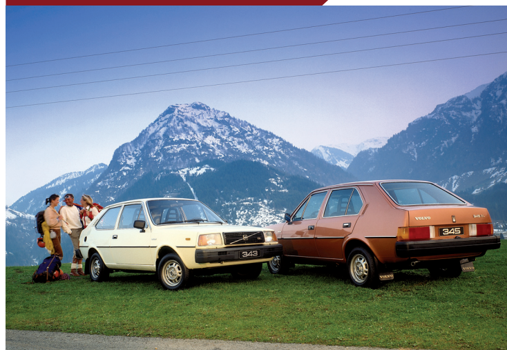
Gedurende zijn vijftienjarig bestaan werd het 300-gamma voortdurend verbeterd en uitgebreid.

Ondanks de moeizame start, komt de carrière van de 300-serie nu alsnog op gang. In 1983 verandert de typeaanduiding, waarbij net als bij de rest van het Volvo-gamma het derde cijfer wordt vervangen door een nul: de 343/345 gaat voortaan door het leven als 340 en de versie met de tweelitermotor wordt de 360. Een jaar later verschijnt er een nieuwe vierdeurs sedan met een traditionele kofferbak, waarvoor de achterzijde iets wordt verlengd. Datzelfde jaar introduceert Volvo ook een dieserversie.